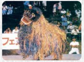
市指定無形民俗文化財 12 普天間の獅子舞