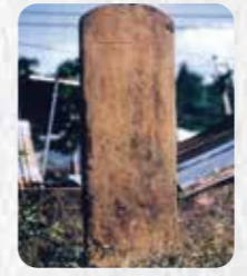
市指定史跡 18 伊佐浜「新造佐阿天橋碑」