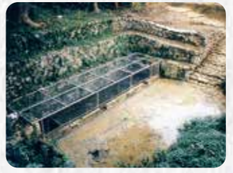
市指定史跡 16 野嵩クシヌカー