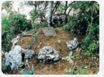
市指定史跡 17 伊佐「たけたう原」銘の印部土手