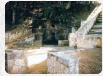
市指定有形民俗文化財 10 我如古ヒージャーガー