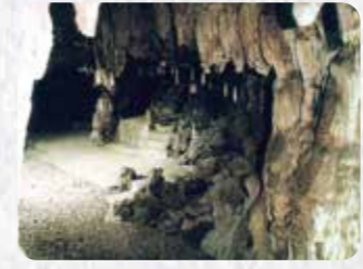
市指定名勝 23 普天満宮洞穴