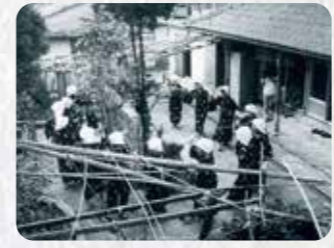
市指定無形民俗文化財 14 我如古スンサーミー