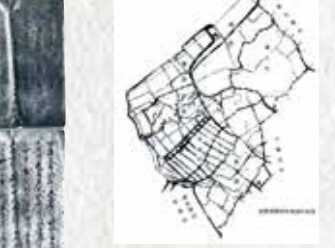
市指定有形文化財 9 明治土地台帳附属地図