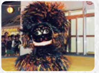
市指定無形民俗文化財 13 大謝名の獅子舞