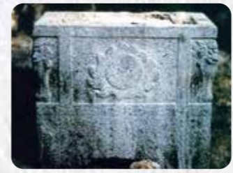
市指定有形文化財 6 小祿墓石彫香炉