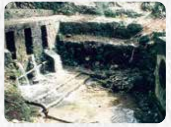
市指定史跡 21 大謝名メヌカー