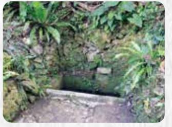
市登録有形民俗文化財 26 神山・愛知ヌールガー