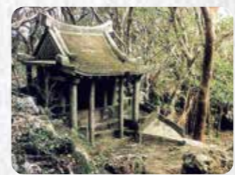
国指定文化財 2 大山貝塚