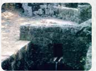
県指定名勝 5 森の川