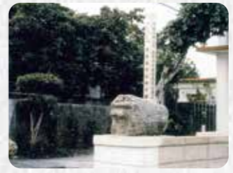
市指定有形民俗文化財 11 喜友名の石獅子群