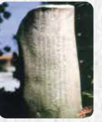
市指定史跡 19 大山御嶽碑