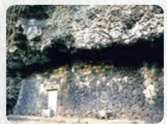
県指定有形文化財 3 小祿墓