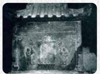
県指定有形文化財 4 小祿墓内石厨子