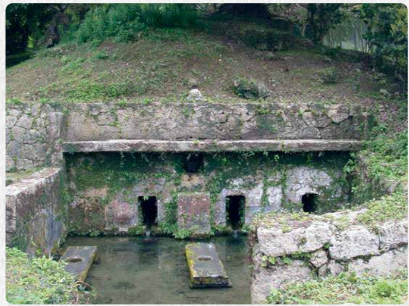
国指定文化財 1 喜友名泉(喜友名区)