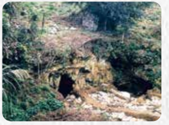
市指定史跡 22 大山マヤーガマ洞穴遺跡