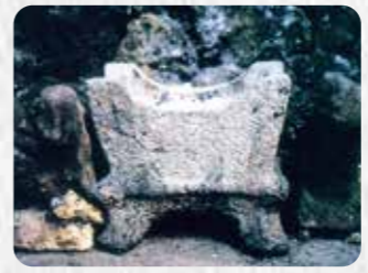
市指定有形文化財 7 小祿墓石彫獅子