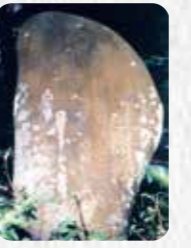
市指定史跡 20 西森碑記