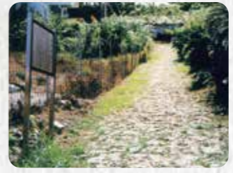
市指定史跡 15 野嵩石畳道