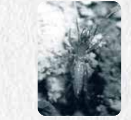
市指定天然記念物 25 ウデナガサワダムシ