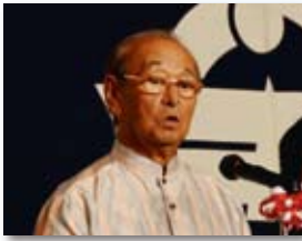
仲井眞 弘多 知事