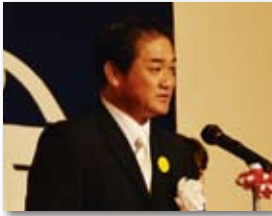
佐喜眞 淳 市長