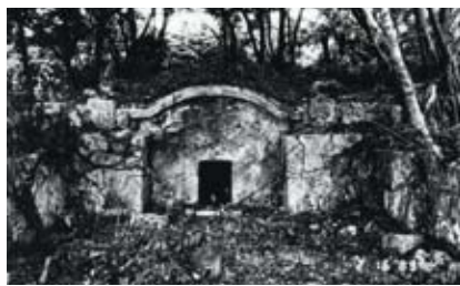
△古墓群内の亀甲墓 [1736年]