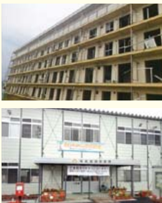
▶4階まで津波に遭った公営住宅 ▶現在の陸前高田市役所 (市民防災室)

陸前高田市の沿岸地域は、広大な平地で市役所、消防署等の行政施設、大型商業施設など中心的な街が形成されておりましたが、東日本大震災の津波によりほぼ壊滅状態となりました。震災から1年8か月余り経過して、残された被災施設の撤去が始まり、これから新たな街づくりを目指していく状況ですが、沿岸地の高上げ等課題が山積しており、遅々と進んでいない様子でした。テレビ等のメディアで被災地の報道を見てきましたが、実際に目の当たりにすると予想以上の被害の大きさに愕然と