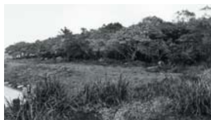
△赤道渡呂寒原古墓群 [ナナチバカ]

古墓群の一所は、地元でナナチバカと呼ばれ、七基の亀甲墓を主に十二基の古墓が横一列に並んでいます。そのうち、三基の亀甲墓には一七三六年、一七五八年、一八二七年と墓造