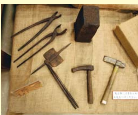
鍛冶屋の道具(市立博物館所蔵)

さてフーチビースの由来ですが、鍛冶屋には熱い鉄を水に入れて冷やし固める「焼き入れ」という仕上げの技法があります。水が冷たいほど良い製品に仕上がるため、旧暦11月の冷え込みのことを、鍛冶屋の道具