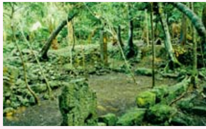
△赤道渡呂寒原屋取古集落の屋敷跡