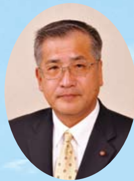
宜野湾市議会議長 呉屋 勉