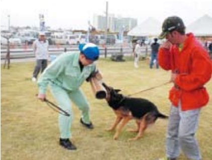
デモンストレーション