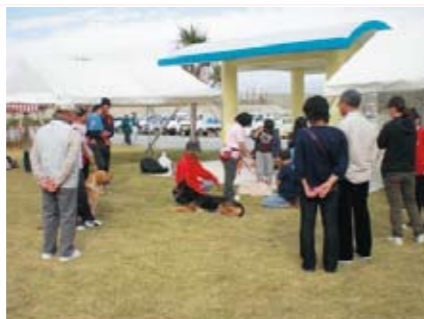
しつけ相談の様子