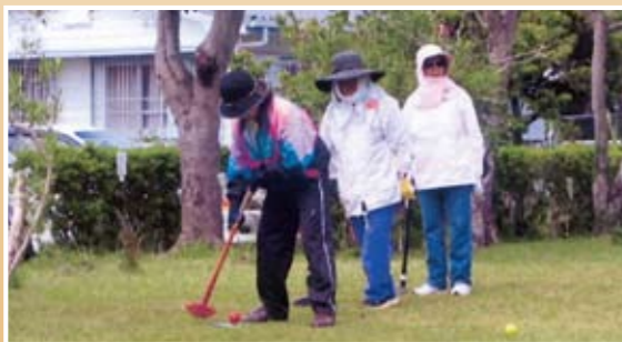
♪グラウンドゴルフサークル♪