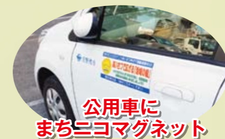
公用車に まちニコマグネット