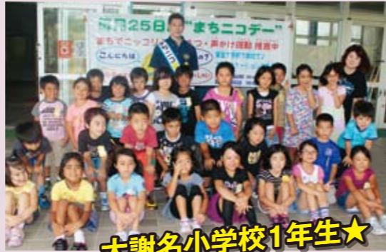
大謝名小学校1年生★