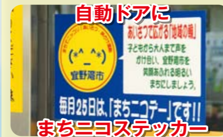
自動ドアに まちニコステッカー

他にもいろいろな取組みをたくさんしています(*_**)あいさつが飛び交う宜野湾市を目指して...☆