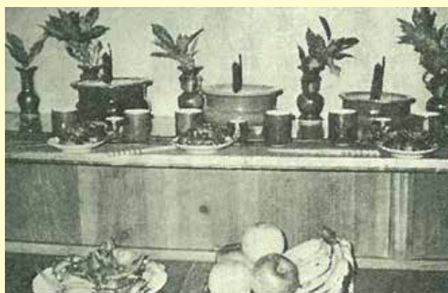
▲フチャギ餅のある十五夜のお供え

獅子舞やマールアシビでは、近隣から大勢の見物客が集まりました。その客目当てに氷や天ぷら売り等、いろんな物売りがやってきて、大変にぎやかだったようです。