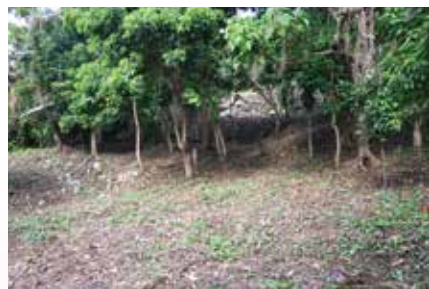
新城上殿遺跡近景(北西より)