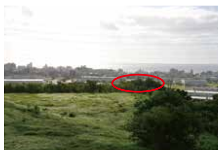
新城上殿遺跡遠景(南より)

新城上殿遺跡 新城出身の民俗学者であり、市の偉人である佐喜眞興英が明治〜大正時代の新城集落の民俗・風習等を取りまとめた『シマの話』には「新城の島（集落は何百年か前、現在の場所（普天間飛行場内）