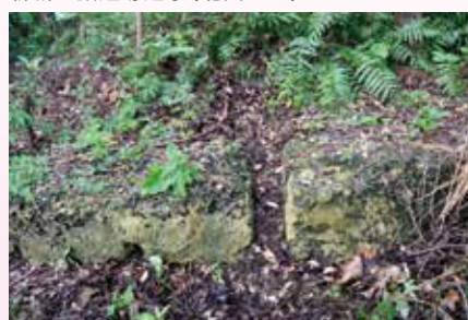
石切り場跡近景(西より)

から西北方の所（字新城小字下原）より移転したと言われ、御嶽屋敷跡などが残っている」と書かれています。イシジャー下流の西側付近の表面踏査により、現在でも屋敷田いと考えられる石垣、区画、道跡や石切り場跡などが残っていることが確認されました。現在、キャンプ瑞慶覧にその面影はありませんが、カンナシーと呼ばれていた大岩に伝わる字新城と字安仁屋の集落移動に関係する伝承とあわせて、普天間飛行場内に、戦前まで字新城の方々が生活していた新城集落の成立・移動・発祥の在り方を知ることが出来る貴重な文化財です。 おわりに 去る六月二四日にキャンプ瑞慶覧（西普天間住宅地区）で、掘削により地下の文化財の有無を確認する試掘調査が日米合同委員会で合意され、市教育委員会で八月月中旬より試掘調査を実施していますので、今後地下から新たな発見があるかもしれません。