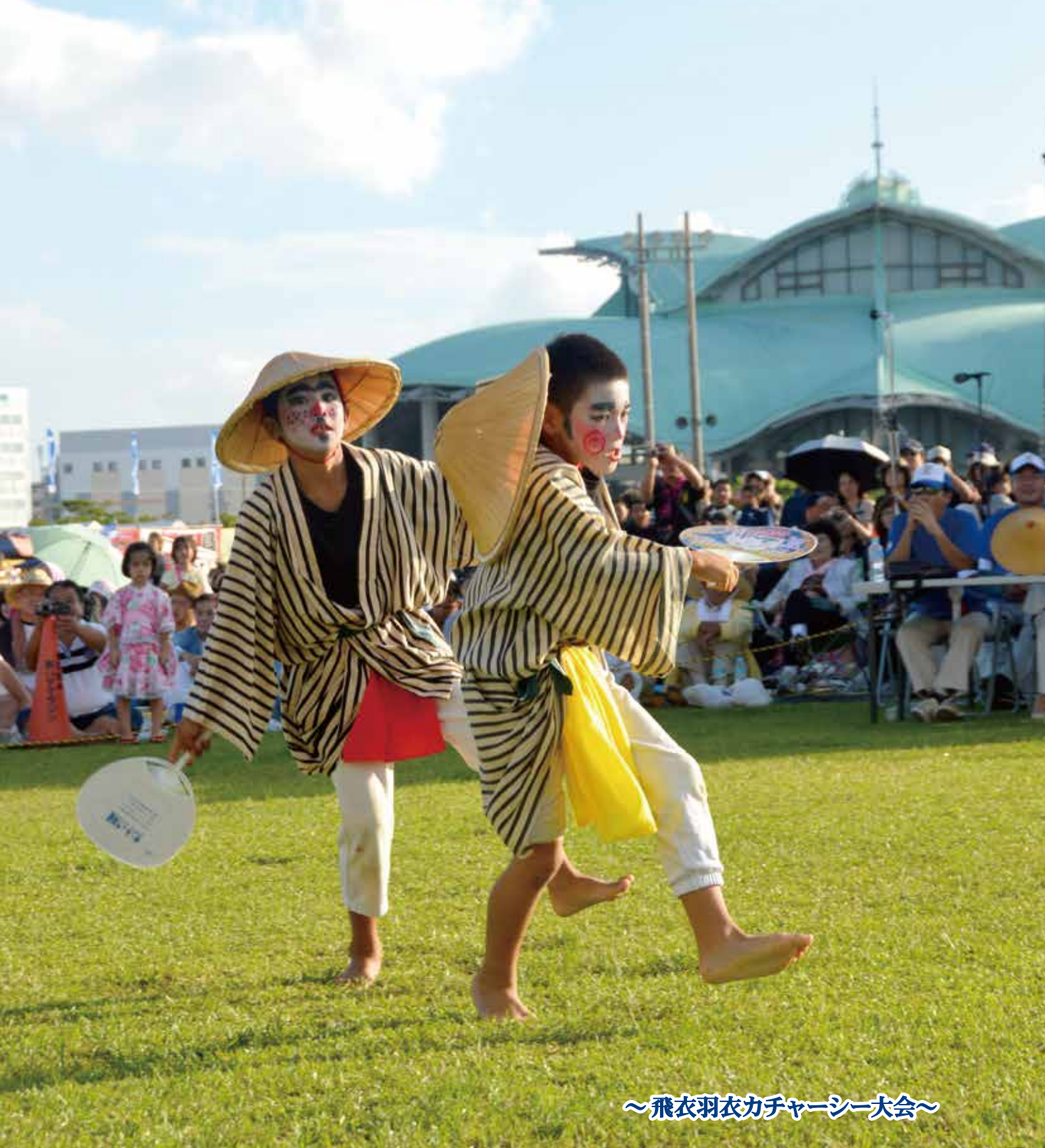
～飛衣羽衣カチャーシー大会～