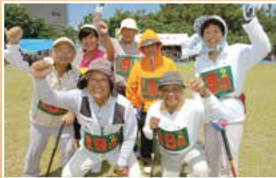
☆グラウンドゴルフ☆