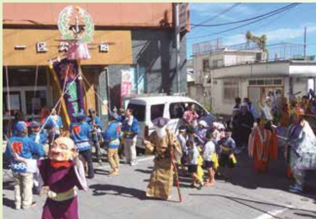
▲野高マールアシビの道ジュネー（2014年）

秋の企画展「宜野湾のムラアシビ」 10月29日（水）～11月30日（日） 入場無料 【問合せ】市立博物館 ☎870-93317