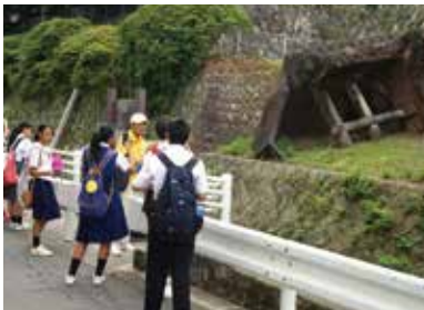
平和案内人による被爆遺構巡り