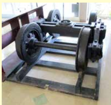
▲市立博物館に展示されている軽便鉄道の車輪

真志喜の市立博物館には、当時の軽便鉄道の車輪が展示されています。ご覧いただき、かつての軽便鉄道の姿を想像してみてくださいがでしょうか。