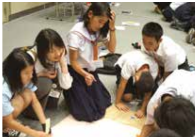
平和宣言文作成(青少年ピースフォーラム)