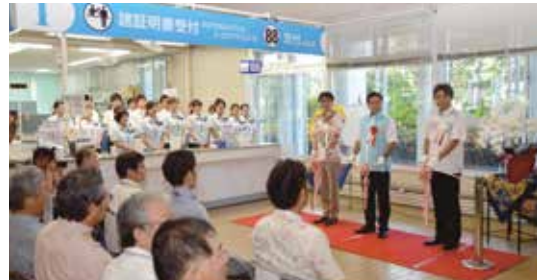
市民課窓口業務外部委託開始セレモニー