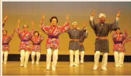
☆レクリエーション大会☆