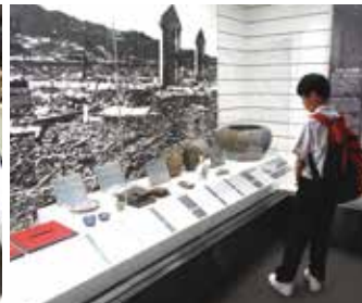
原爆資料館を見学