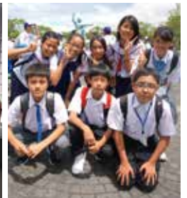
原爆犠牲者慰霊 平和祈念式典へ参列