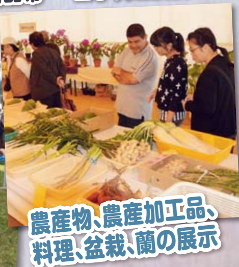
農産物、農産加工品、 料理、盆栽、蘭の展示