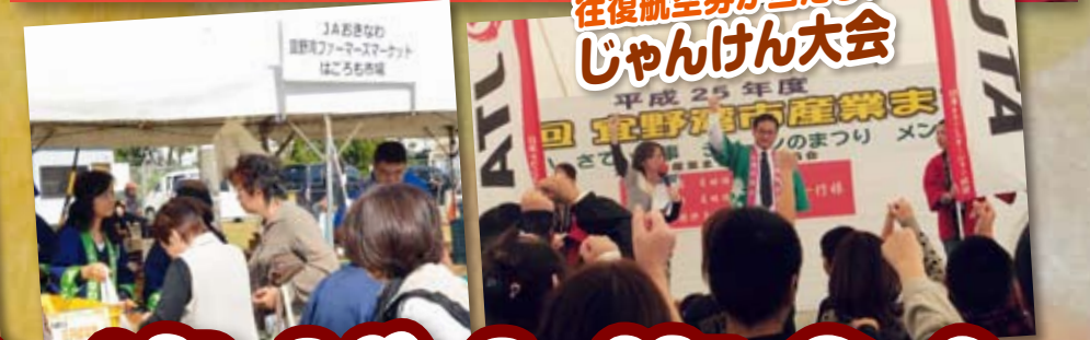
往復航空券が当たる! じゃんけん大会