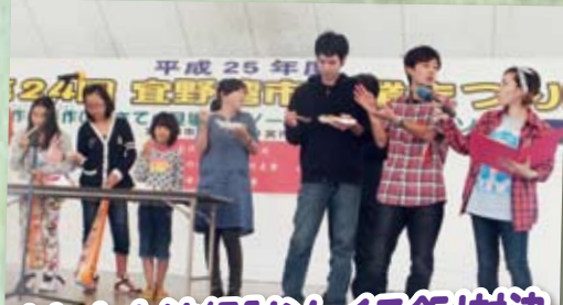
よしもと沖縄「なんくる飯」対決