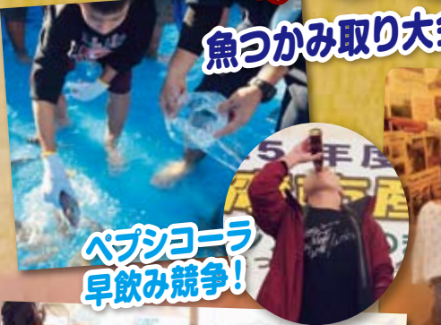
魚つかみ取り大会