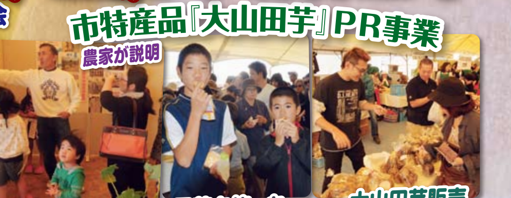
市特産品『大山田芋』PR事業