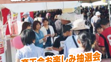
商工会お楽しみ抽選会