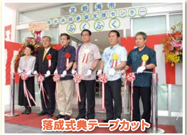
落成式典テープカット

このセンターは、男女共同参画社会を推進するため、各種団体の学習および交流のための中部圏域の中核施設として設置されました。 ※「人材育成交流センターめぶき」に隣接