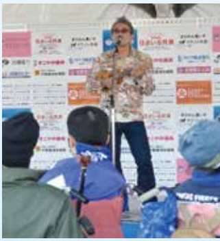
ジョニー宜野湾さんのライブ