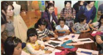
14 LINENを使ったコサージュづくり ～ファッションデザインのおしごと～ LEQUIO(レキオ)(喜友名)