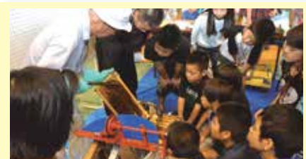
13 はちみつを採取しよう!! 島みつばち園(宜野湾)