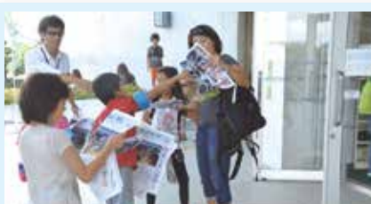
3 新聞記者になって“速報”をつくろう!! (株)琉球新報社(那覇市)

あこがれをみぢかに、 ゆめをもくひょうに。 地域の住民・企業人等が講師や運営スタッフとなり、子どもたちに「夢」と「希望」をあたえ、職業観やチャレンジ精神を育むことを目的に開催されました。さまざまな仕事や働くことの大切さ、生き方のヒントなどを伝える地域主体のキャリア教育学校です。