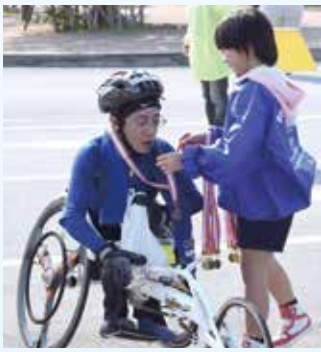
完走者にメダルを贈呈