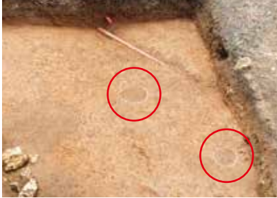
柱穴跡と考えられる遺構(○部分)