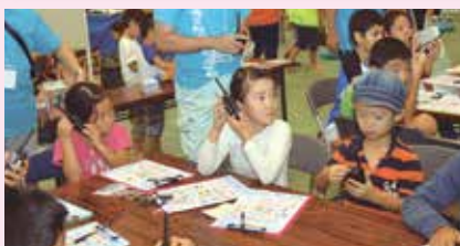
20 トランシーバーで遊ぼう! (株)沖縄電子(大山)