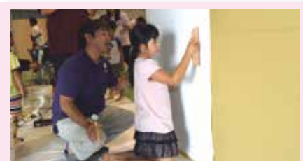
4 壁紙クロスを貼ってみよう! (有)リフォーム施工(野嵩)

あこがれをみぢかに、 ゆめをもくひょうに。 地域の住民・企業人等が講師や運営スタッフとなり、子どもたちに「夢」と「希望」をあたえ、職業観やチャレンジ精神を育むことを目的に開催されました。さまざまな仕事や働くことの大切さ、生き方のヒントなどを伝える地域主体のキャリア教育学校です。