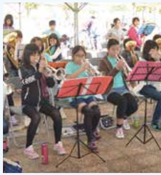
吹奏楽で盛り上げてくれた 普天間小学校の皆さん