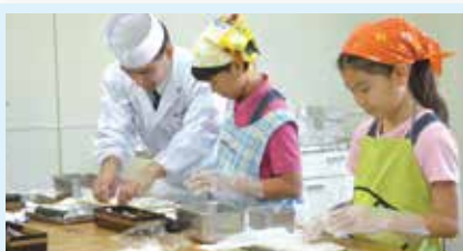
11 ホテルレストラン職人から 本格的巻き寿司を習おう! (株)ラグナガーデンホテル(真志喜)