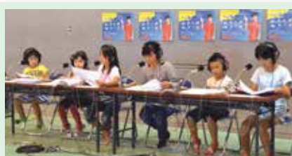
27 アニメ声優にチャレンジしよう!! 琉球朝日放送(那覇市)