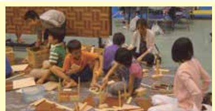
28 わくわく木工体験 三和木工所(我如古)