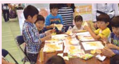
12 健康なウチを作ってみよう ～おなかの中のふしぎ～ 沖縄ヤクルト(株)(大山)