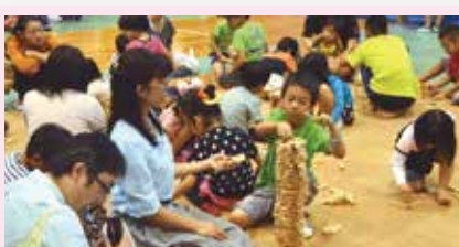
29 親子で楽しめる木のおもちゃ カーサ・マチルダ(浦添市)