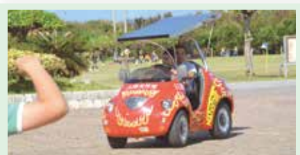
31 ソーラーカー試乗体験 (株)日進ホールディングス(長田)