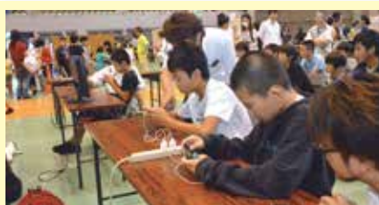
9 本格的な3Dスマホゲームを 体験してみよう! 琉球インタラクティブ(株)(宇地泊)