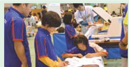
10 メッセージTシャツをプリントしよう! ～スポーツ店のおしごと～ スーパースポーツゼビオ宜野湾店(真志喜)