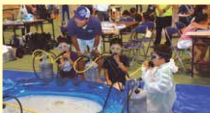
5 水の中でも呼吸ができる!? ～ぶくぶくミニダイビング体験～ 宜野湾マリン支援センター(大山)