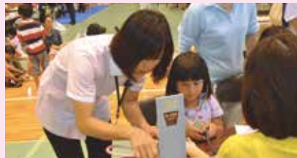
18 ナースのおしごと ～おばーの健康診断日記～ 統合医療センター クリニックぎのわん(大山)