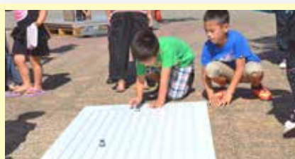
30 ソーラーミニカーをつくってみよう! ～太陽光発電のお仕事～ (株)日進ホールディングス(長田)