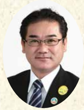
宜野湾市長 佐喜眞 淳