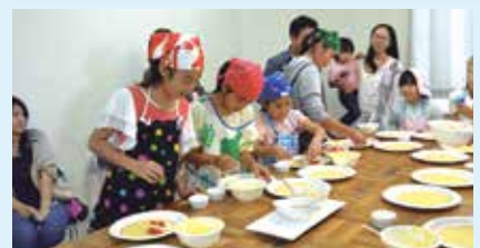
22 フルーツクレープ包みをつくろう! ～ホテルシェフのおしごと～ ムーンオーシャン宜野湾ホテル&レジデンス(宇地泊)