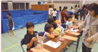
1 クリスマスアレンジをつくろう!! ～フラワーデザインのおしごと～ Fleurくる(愛知)

11月24日(月)、宜野湾市立体育館において「グッジョブ体験inぎのわん」が開催されました。市内で活動する事業所を中心に31のおしごと体験コーナーが設けられ、「プロ」の説明・指導を受けながら実際の仕事を体験することができました。訪れたたくさんの子どもたちは、楽しい一日を過ごしました。