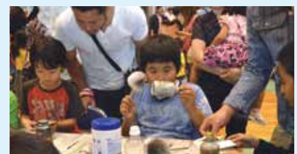
7 鑑識って何? ～警察のおしごと～ 沖縄県宜野湾警察署(真志喜)