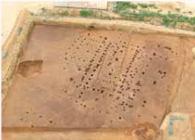
海軍病院移設予定地にて確認された掘立柱建物跡