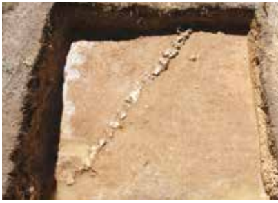
土留めと考えられる石列

試掘調査の成果 約二十箇所での調査ですが、二十m程の石灰岩を一行に並べた石列や柱が立てられていたと考えられる穴の跡(遺構)が三箇所確認されています。石列は、戦前(近世)江戸時代相当(頃)での土留めであると考えられます。穴の跡は二