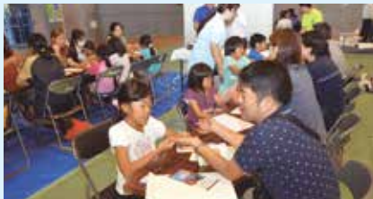
17 ハンドマッサージ&水質検査 ～温泉のおしごと～ 天然温泉アロマ(大山)