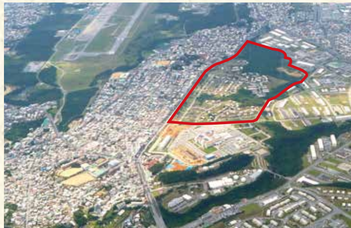
返還が決まっているキャンプ瑞慶覧西普天間住宅地区