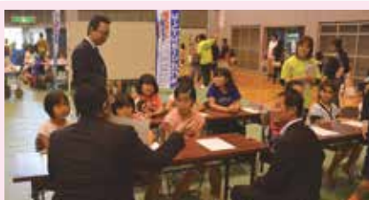
8 英語でauショップのおしごと (有)NCCプラザ企画(我如古)