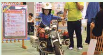
6 ミニ白バイに乗ろう!! ～警察のおしごと～ 沖縄県宜野湾警察署(真志喜)