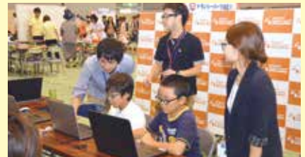
19 キャラクターデザインにトライ! ～Webデザイナーが教えるデザイン体験～ (株)プロトデータセンター(大山)