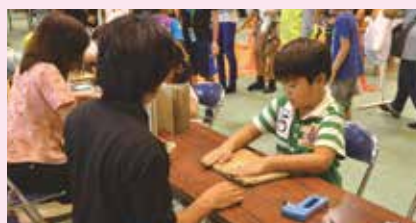
24 ミニ畳づくり (株)大山タタミ店(野嵩)