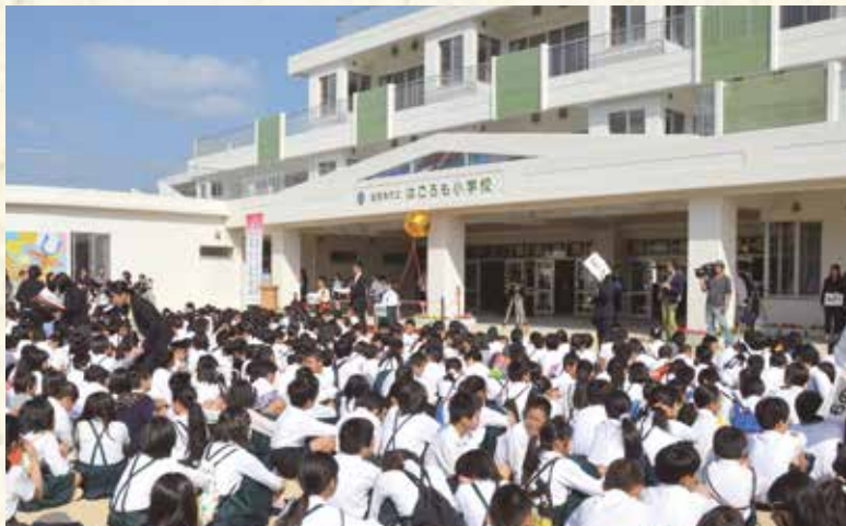
昨年4月に開校した市立はごろも小学校