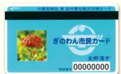
ぎのわん市民カード

※すでに自動交付機の利用設定を行った「住民基本台帳カード」については、今後も自動交付機のご利用は可能です。