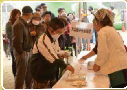
▲ムジ汁(左)、イカ汁(右)の試食に、多くの人が集まりました