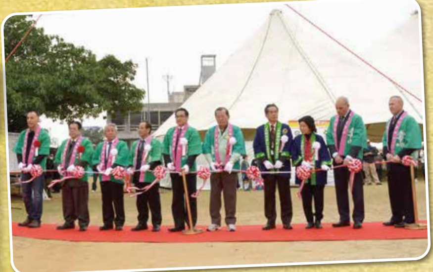
▲産業まつりを運営する各団体が勢ぞろいしてテープカット

田芋のムジ汁やイカ汁の試食に多くの人が舌鼓を打ち、新潟産米30kgの当たるじゃんけん大会、緑化推進事業の一環でもあるサンダンカの木苗無料配布、毎年大歓声が上が