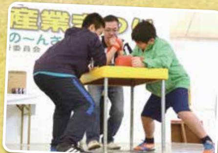
▲熱戦続きのアームレスリング大会