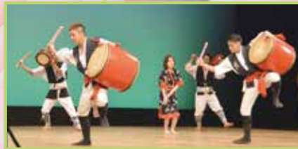
市青年連合会による劇(左)。市青連は式典開始前の会場整理も行いました(右)。