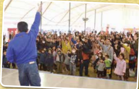
▲白熱!新潟産米30キロが当たるじゃんけん大会