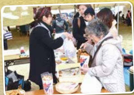
▲お客さんとのふれあいも大切です