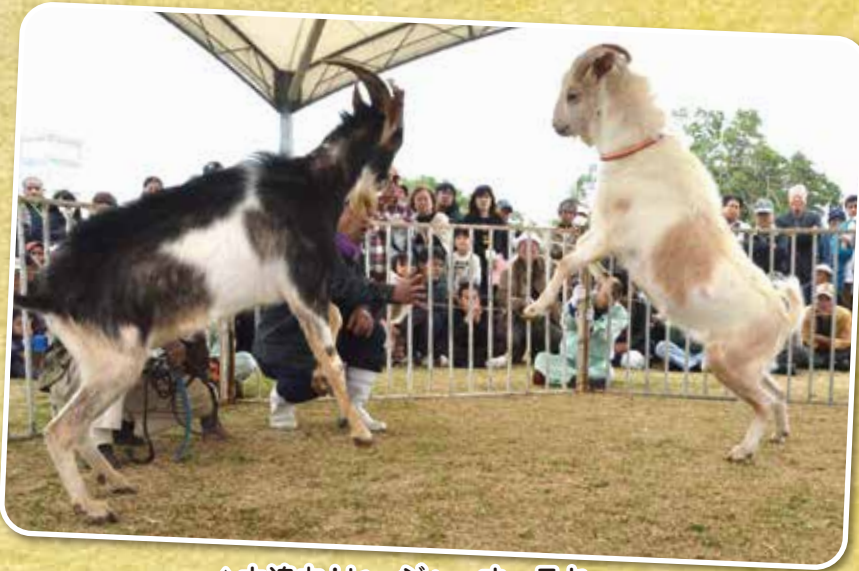
▲大迫力!ヒージャーオーラサー

る迫力満点のヒージャーオーラサー ラサーなど、産業まつりなら ではのイベントに盛り上がり を見せました。 またステージでは、保育園 児たちによるエイサー、市内 4団体による空手演武、ジヨ ニー宜野湾さんやR3の皆さ んによるライブなど、次々と 観客の目を引く催しが行わ れ、会場は和やかな雰囲気 に包まれました。