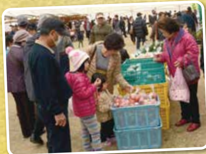
▲野菜が格安で購入できます