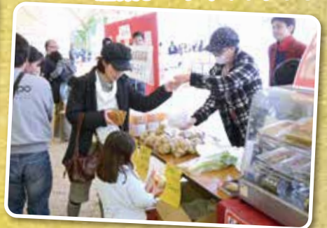
▲おいしい食べ物もいっぱい!