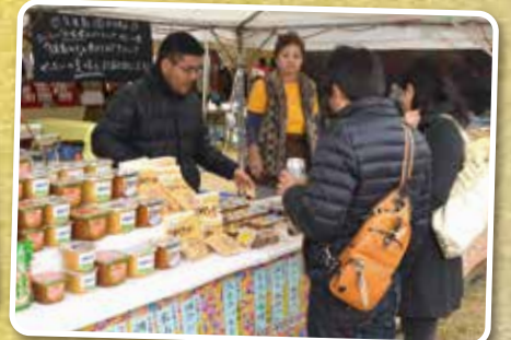
▲いろんな種類を取りそろえています