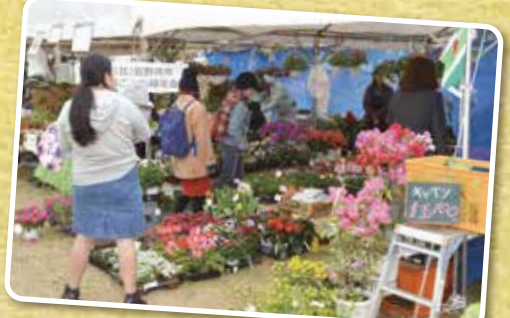
▲色とりどりの花を販売