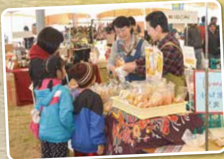
▲市の推奨特産品も購入できます