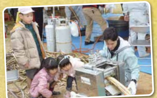
▲サトウキビをしぼってみよう!