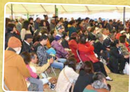
▲たくさんのご来場ありがとうございました!