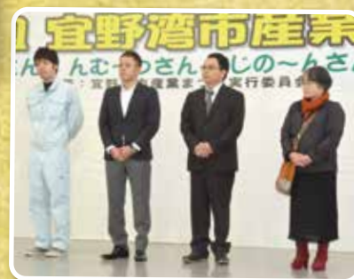
▲公募したキャッチフレーズで入賞された皆さん