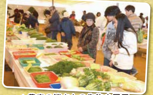
▲農家の皆さんの作物を展示