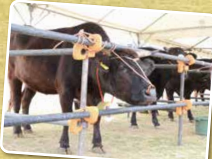
▲大事に育てられた牛