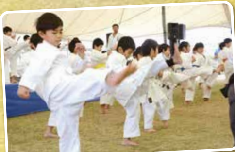
▲熱のこもった空手の演武