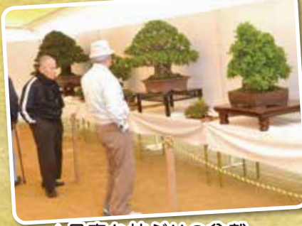
▲見事な枝ぶりの盆栽