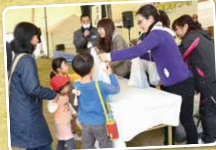
▲サンダンカの苗木を無料配布