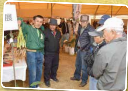
▲農家による田芋の説明