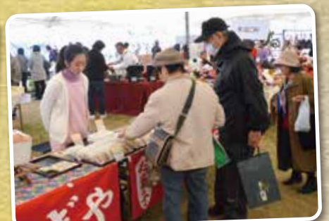
▲お土産にお菓子を