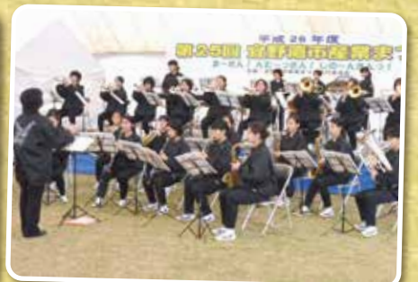
▲オープニングセレモニーで演奏を披露してくれた嘉数中の皆さん