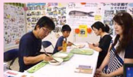
おはしで豆を上手に運ぼう！