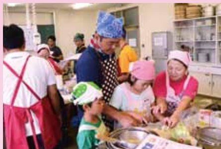
親子でヘルシー料理の作り方を学ぶ