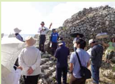
市民講座の様子(平成26年10月グスクめぐり)

当館では、市民の皆さまが「学び」や「学び合い」を通して、歴史、年中行事や祭りなどの民俗、地域に残る文化財に親しみを持っていたとき、地元である宜野湾市の良さをもっと知って欲しいと考えています。また、市外から転入されてきた方々も、ぜひ当館に足を運んでいただき、新たな宜野湾市民として、過去に住んでいた地域と比べながら、「学び」を体験してほしいと思っています。