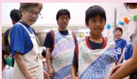
妊婦さんの大変さを体験