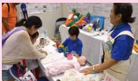
上手におくるみを着せられるかな？