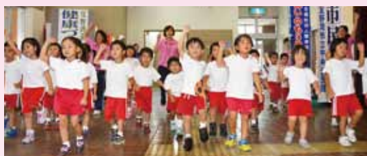
あいのもり保育園の園児たち