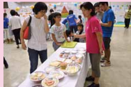
食品のカロリーはどのくらい？