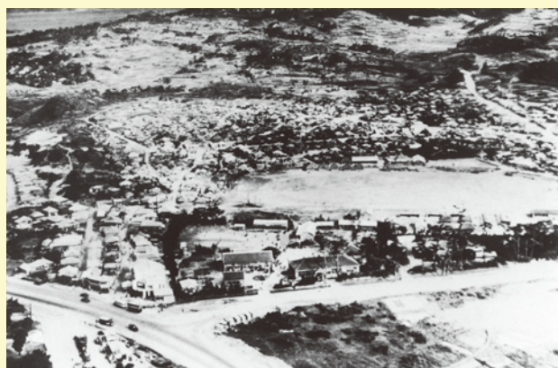
普天間高校側からみる普天間総合グラウンド 1953(昭和28)年