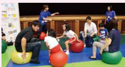
バランスボールで体幹強化

特定健診の受診率向上に取り組んだ5自治会に表彰状が贈られました。 大規模地区：長田区・宜野湾区・愛知区 中規模地区：嘉数区 小規模地区：嘉数ハイツ