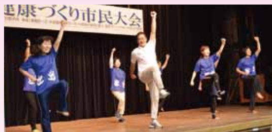
元気よく美らがんじゅう体操を披露しました！