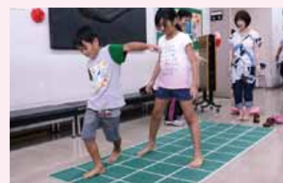
複数の作業を同時にこなすステップ