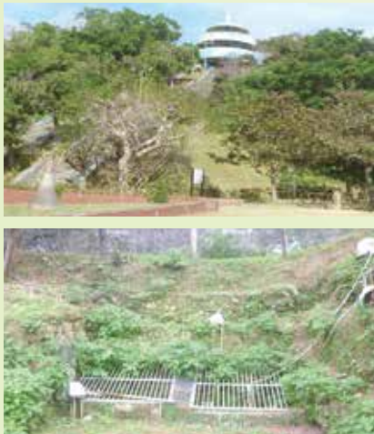
▶嘉数高台公園（イーヌヤマ） ▶嘉数のアガリガーヤ

博物館では3月8日（日）まで、「字」展「嘉数」根立て杜ぐすくなよろらてつきし字」を開催しております。みなさま、ぜひ博物館へお越し下さい。お待ちしております。