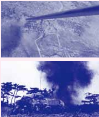
家屋から火の手が上がる宇地泊(上) 日本軍の砲撃を受ける米軍(下) 1945(昭和20)年

市立博物館では沖縄戦・戦後70年の企画展と市民講座を開催します。6月は沖縄戦を、7月は戦後復興をテーマに企画展を行います。沖縄戦から70年が経過し、戦争体験者も減りつつあるなか、戦争に対する風化が危惧されており、戦争と平和を考える機会でもあります。時期や時代の節目を読み取り、展示や講座を通して多くの方々へ学びの場をご提供するのにも博物館の役目です。多くの皆様のご来場、お待ちしております。