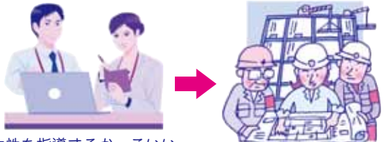
女性を指導するカッコいい男性のイラストばかり使われているけど… その逆だってあり得るよね！

「メディアリテラシー」を身につければ、メディアが「当たり前」や「ジェンダー」を作っていることを読み解くことができ、結果それに影響されにくくなります。そのため自分の考えも相手の考えも尊重できるようになり、自分らしい選択ができたり、より良い人間関係を築く事にもつながります。