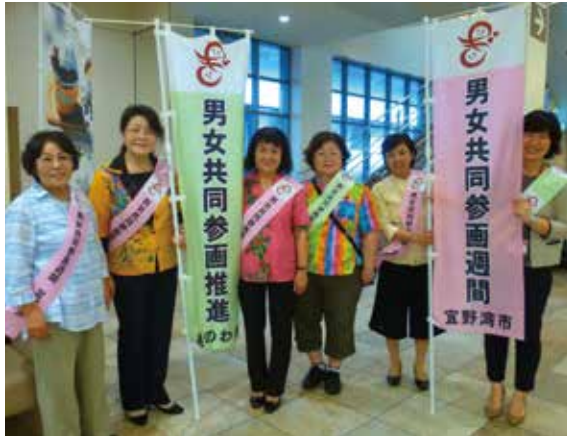
▲サンエー宜野湾コンベンションシティでの街頭活動～宜野湾市・参画週間手作りティッシュ配布～

6月16日(木)に行われたオープニングセレモニーは市女性団体連絡協議会・地域連絡会委員などのご協力により大盛況となりました。ご参加頂いた市民の皆さまありがとうございました。