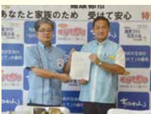
▲県産品奨励月間実行委員会より要請