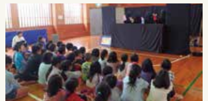
↑人形劇を活用した豊かな心を育む事業