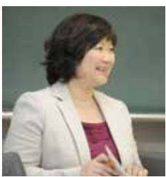
宜野湾市市民協働推進協議会 委員長