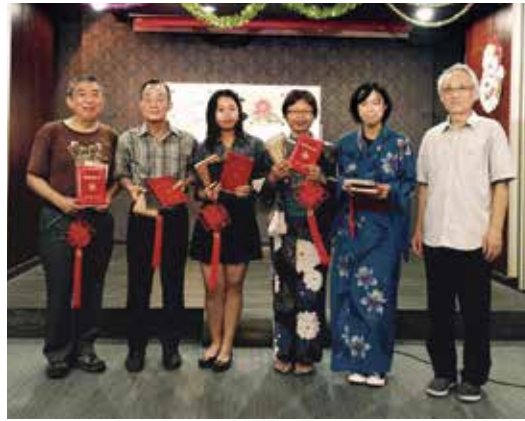
↑留学生コンテスト表彰式(右から3番目)

この一年間、辛い事も正直たくさん有りましたが、それに負けないくらいの楽しい事や嬉しい事がたくさん有りました。この留学での1つ1つの出来事がそして皆さんの方達との出会いが私を成長させこんなにも素晴らしい留学生活を送ることが出来ました。皆がみんな出来る留学では無い中、私は厦門での留学を経験出来た事がとても貴重で幸せに感じます。