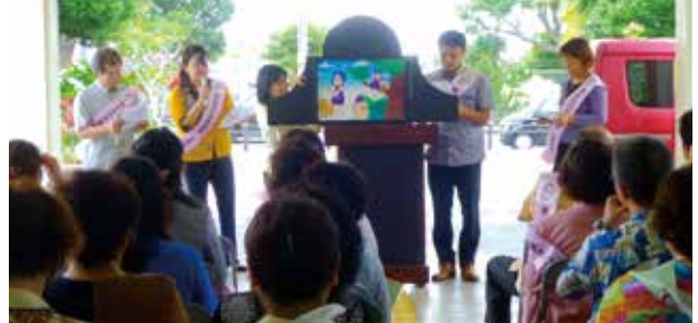
▲地域連絡会委員による紙芝居 ～昔話～「桃太郎」が女の子だったら? 「桃子のメッセージ」をうちなーぐちで好演(*^_^*)