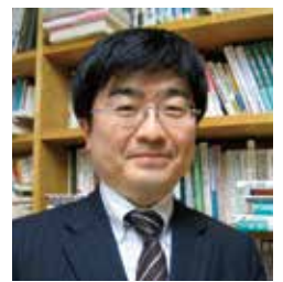
高崎経済大学地域政策学部地域づくり学科 教授

これからの地域社会には丁寧なひとづくりが求められます。すぐに結果を求めるのではなく、試行錯誤をむしろ楽しみながら、根気強い地域づくりをご一緒に進めていきましょう。