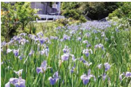
4月頃、約2,000本のオクラレルカが満開に。

今では、チブガーラは見事に蘇り、その奥の拝所であるチブ井の湧水から続けせせらぎには希少生物のエビ、カニ等がすみ、地域の子どもの達の自然学習の場として活用されています。また、オクラレルカ、桜、コスモス、カンナ等の花が季節ごとに目を楽しませ、地域住民の憩いの場、交流の場となり地域の宝となっています。