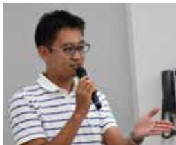
NPO法人 まちなか研究所わくわく

市および市社会福祉協議会と協働して「ぎのわん地域づくり塾」の企画・運営をさせていただきます。この塾では「ひとりの困りごと」を「地域の困りごと」として、いろんな人や力、資源をつなぎ合わせて、解決への動きをつくり出す「地域コーディネーター」の育成を目指します。地域の課題を見極め、みんなが話し合い、考え、悩みながら、解決への動きを作り出す力を磨き合います。