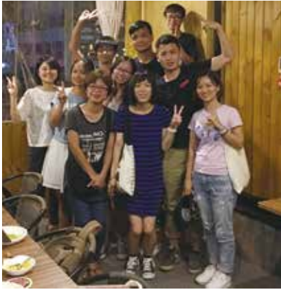
↑日本語交流会の食事会

この一年間、本当にあつという間に時間が過ぎました。毎日が新しい出会いと発見のある日々で、とても充実した留学生活を送ることが出来ました。留学生活を始めた頃は全く中国語を話す事、聞く事が出来ず、拙い英語で先生方や中国の学生さん達と交流し、日本語の堪能な学生さんや同じ日本人留学生の方達に助けて貰いながら何とかやってきました。まだまだ堪能とは言えませんが、中国語での会話を少しは楽しめるようになった事を嬉しく思います。