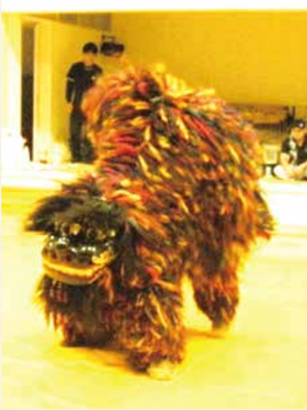
▲2012(平成24)年撮影 大謝名の獅子舞 1989(平成元)年市指定無形民俗文化財に指定されました。

大謝名の獅子舞は、戦後長らく途絶えていましたが、1976(昭和51)年に復活し、現在は年に1回旧暦8月15日の豊年祭に行われています。当日は、有志の方々が獅子を拝んだあと、ムラの拝所で獅子舞の開催と集落の繁栄を祈願し、獅子舞と一緒に集落内の道筋をまわります。獅子舞を行うことを、「シー・シ・ケラシ」といい、大謝名の獅子舞は、「けんか獅子・男獅子」とも呼ばれています。その踊りはシンプルで、舞台の四方と中央で噛みつく動作を行います。この噛みつく動作は、獅子本来の魔除けの性質を表しています。また、集落の人びとは、獅子の姿を見たり触れることで健康な体になると信じて、競って獅子に触るようにしていました。このように、大謝名の獅子舞は災いからムラや人を守る守護神として人々から信仰をうけているのです。市立博物館では、夏の企画展「ムラを守る神々」を7月27日(水)〜9月4日(日)の期間で開催しています。人々の暮らしに根ざした御嶽や神々などを紹介します。ぜひ、ご覧ください。