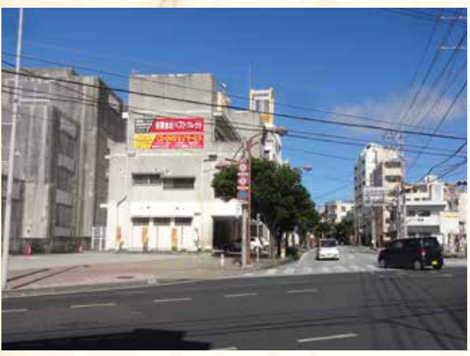
2016(平成28)年 普天間本町通り(写真左側建物がアトリエ跡)