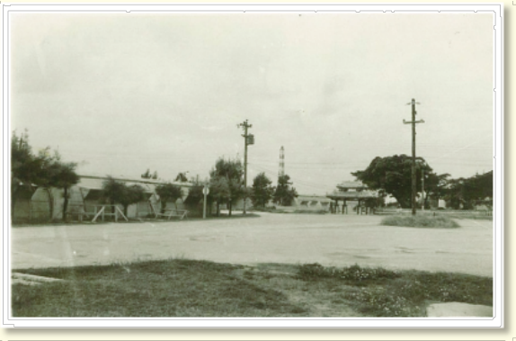
▲宇地泊 キャンプ・ブーン入口 年代不詳 中央右に守礼門が見えます。

上の写真右側に写る守礼門は、1960（昭和35）年代、宇地泊にあった米軍施設「キャンプ・ブーン」の入口です。また隣接して「琉球警備連隊（琉球特別警備大隊）」本部が、米陸軍の技術施設や管理施設、住宅地区の保安を目的としてキャンプ・ブーンに置かれていました。戦前は宇地泊の民家が立ち並んでいましたが、戦後その場所は米軍施設となり、1960年代始めから周辺は外国人向け貸住宅が多く建設されました。