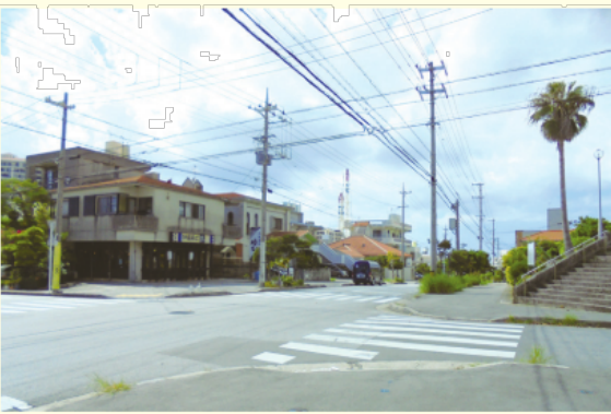
▲宇地泊 現在の様子 2017(平成29)年