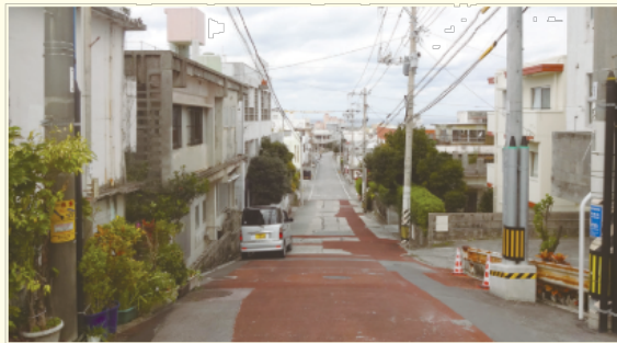
▲現在の様子 2018（平成30）年2月