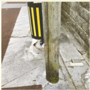
▲木製電柱 1967年当時はコンクリート製の電柱ではなく木製電柱が使用されており、現在も1本残っていました。