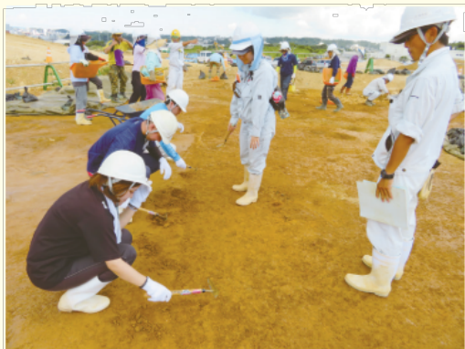
▲発掘作業を体験するインターンシップ生

発掘現場ではいろいろな人たちが働いています。例えば宜野湾市では、教育委員会の職員や発掘のサポート会社の方々になります。教育委員会の職員や、発掘のサポート会社は、遺跡を調べのお仕事をします。遺跡の石器や土器などの「遺物」、建物の跡などの「遺構」