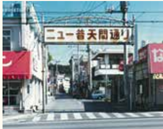
◀ニュー普天間通り 1980年代