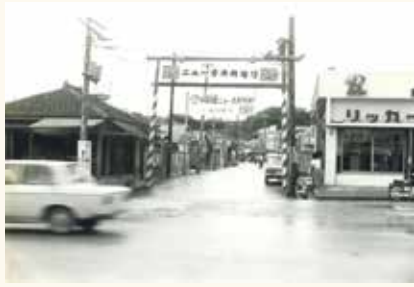
▲ニュー普天間通り 1966(昭和41)年 この年に舗装工事が竣工しました

上の写真は、1966(昭和41)年10月18日に撮影されたニュー普天間通りの様子です。「茶ぐわ〜ゆんたく」164号で紹介しました新開通りと同様に舗装工事が行われ、アスファルトが敷かれて通行し易くなりました。本市は1962(昭和37)年に市に昇格した後、都市計画が進められ、同時に市民の生活に直結する既設の道路整備も重視されました。このと