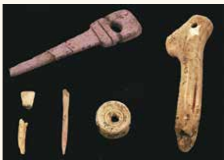
▲大山貝塚出土の装身具等 沖縄県立博物館・美術館所蔵