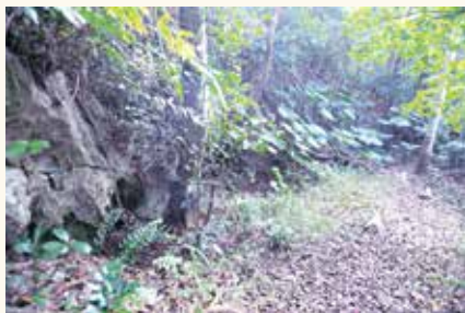
▲大山貝塚(ミスクムウイ) 大山の「ジミー」の裏手の坂道を登りきった ところにあります