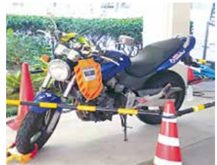
▲実際に差押えたバイク

平成29年度徴収強化月間の実績 ・預金等差押：236件 ・不動産差押：10件 ・自宅等の捜索：17件