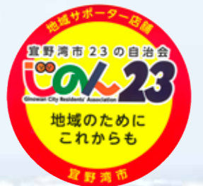
▲地域応援ステッカー