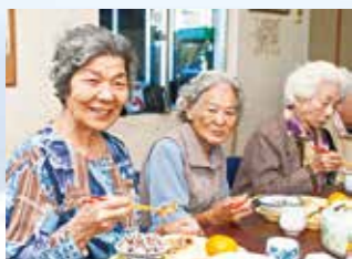
▲ミニデイサービス