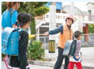
▲子どもの登下校の見守り