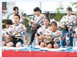
▲子ども学習支援事業

【問合せ】事業所の最寄りの自治会もしくは、 宜野湾市役所 市民生活課 (☎893-4497) まで