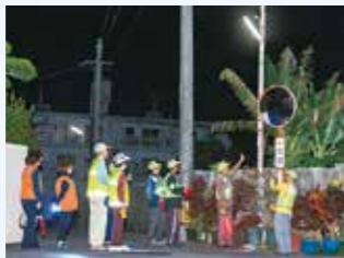
▲防犯灯の設置・管理