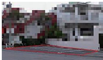
▲番号1の公売物件です

・物件は現時点での予定です。今後追加、取下げ、変更する場合があります。 ・物件の詳細については、納税課窓口、ホームページでご確認ください。