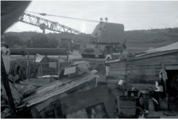
▶1955年7月19日頃に伊佐浜で撮影された写真 ―当時、米軍に見つからないように、家の中から壁に穴をあけて撮影するなど工夫し、人びとに状況を伝えるために必死の思いで撮影したという貴重な写真。