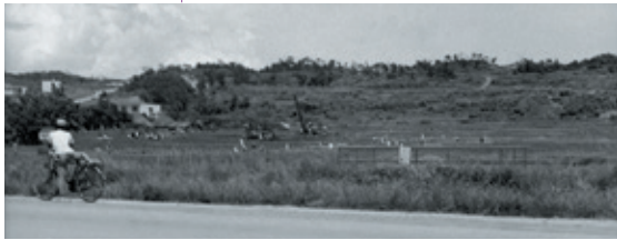
▼写真② 畑で何かをする人たち 1955年7月19日前後。土地を接収された伊佐浜住民が畑で芋を掘る姿と思われる