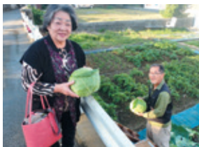
▲会員への野菜のお裾分け

ファーム(農場)での収穫の様子▶ 子ども達の元気で大きな笑い声が響き渡る(2021年2月)