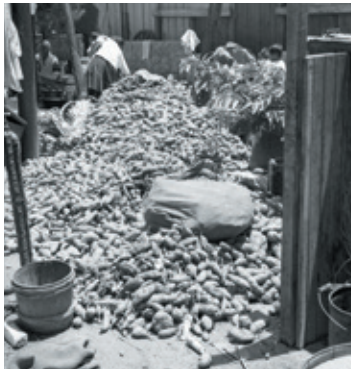
▲写真① 山積み芋 1955年7月19日前後。家を接収された伊佐浜住民が仮住まいする大山小学校

写真①は「山積み芋」。強制接収後、伊佐浜住民が大山小学校での仮住まいを始めた頃にそこで撮られたものと思われませんが、この芋はどこから出てきたのか？琉球政府が仮住まいの住民のために米や魚缶などを支給したとはありますが、芋のことは書かれていません。