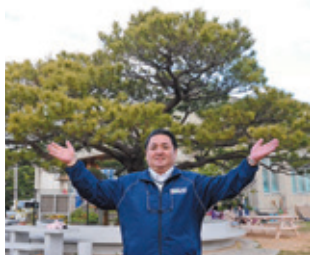
▲2代目我如古平松 平松周辺にはゆんたくできるベンチや遊具があり、憩いの場となっている

公民館側の広場にある2代目平松がとても魅力的です。 1代目は我如古交差点から浦添方面向け徒歩すぐの場所にあり、琉歌にも登場するなど、枝ぶりが素晴らしい樹齢300年を誇る名木でしたが、戦災で失われてしまいました。1代目の面影があり、旧公民館敷地に立っていた平松を2代目として1987年に現在の場所へ移植しました。見事な樹形で区のシンボルとなっています。