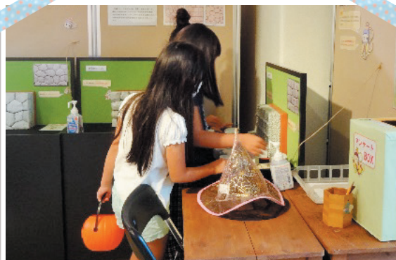
▲体験展示の感染予防対策 消毒液を設置し、安心して参観体験できるようにしました