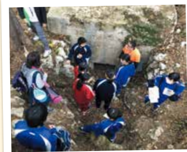
▲嘉数高地 トーチカ

世 世界平和を希求する「宜野湾市反核、軍縮を求める平和都市宣言」の理念の下、戦争の悲惨さ、平和の大切さおよび命の尊さを次代へ継承する宜野湾市平和大使の令和2年度学習報告会を開催しました。 本事業は、昨年度まで平和学習派遣事業として実施していましたが、平和を継承していく者同士の絆の構築と世代間の繋がりをつくり、継続的に本市の平和事業に関わっていただくための環境を整えるため、名称を宜野湾市平和大使育成事業へと変更し、青年層を追加するとともに新たに認定証を交付しました。