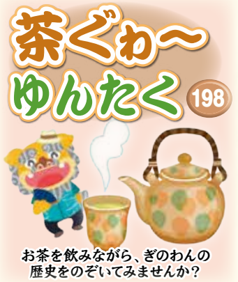
お茶を飲みながら、ぎのわんの歴史をのぞいてみませんか？