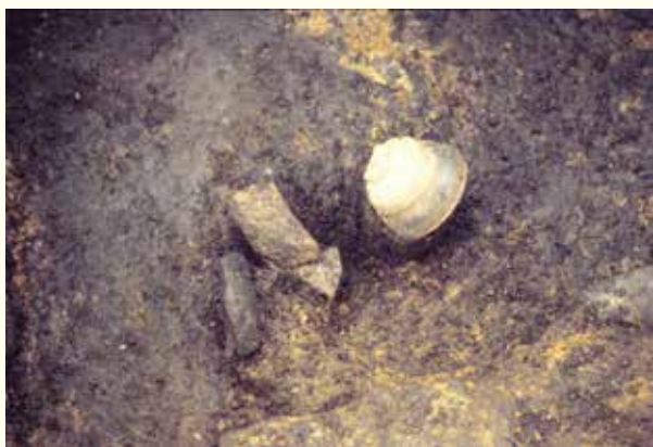
▲グスク時代の土器や陶磁器など