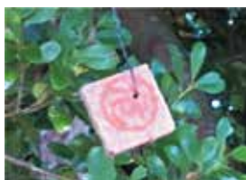
▲誘殺板(「危」の印字有り)

ミカンコミバエは、主に果物等に寄生する害虫ですが、1986年には沖縄県全域から既に根絶しており、現在日本では生息していない虫です。しかし、台湾やフィリピンなどの東南アジアでは今でも生息しており、台風の風や人および物流により、再侵入する可能性があり、それを防ぐため、沖縄県では関係機関と連携して、現在でも予防防除を行っています。予防防除では、誘殺板を街路樹等に取り付けます。防除へのご理解・ご協力、よろしくをお願いします。なお、誘殺板には触らないようにお願いします。