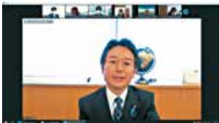
上杉謙太郎外務大臣政務官表敬