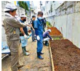
▲花植え活動 地域的美観を確保する