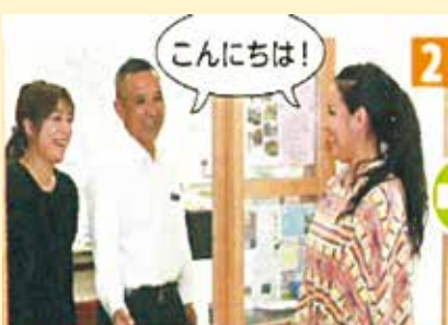
▲自治会のこと、地域のことを住民へ丁寧に説明しています