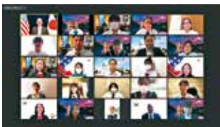
オンライン交流の様子

※TOFUプログラムとは…「アメリカで沖縄の未来を考える(TOFU:Think of Okinawa's Future in the U.S)」プログラムの略称。沖縄の将来を担う高校生・大学生を米国に派遣し、関係者との意見交換や各種視察等を通じ、語学としての英語力向上を図るとともに、英語を用いて様々な分野について学ぶ教育機会を提供することを目的としたもの。