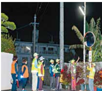
▲防犯灯の設置、定期点検

「住民に安全と安心をお届けすることは、自治会の重要な役割でありますので、警察とも連携し治安維持を図るための取り組みを進めています。なお、防犯灯に係る維持管理費は、自治会費で賄われています。」