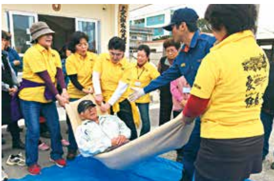
▲災害時を想定した防災訓練

そのような状況の中では、地域住民一人ひとりが、自分ごとと捉え、「自分たちの地域は自分たちで守る」という共助の取り組みが大変重要です。