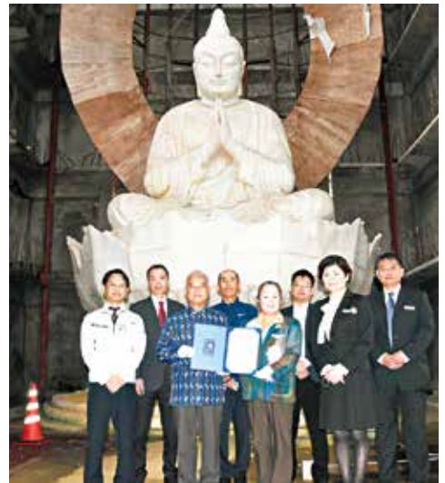
新垣専務理事(中央左)、知念教育長(中央右)