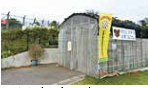
▲オオゴマダラの家 (上大謝名さくら公園の一角)

また、上大謝名にある「オオゴマダラの家」は、子ども達への自然学習や飼育体験をおし、自然環境の素晴らしさを伝え、好奇心を育む場となっています。