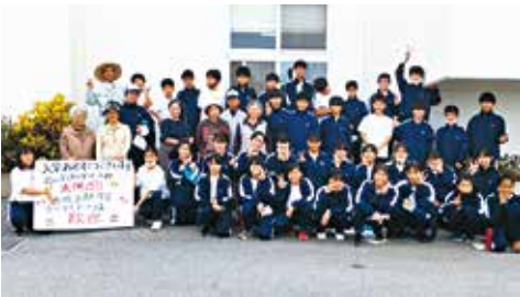
▲真志喜中学校の地域貢献学習 地域への関心や愛着を生み、将来の担い手育成につながる

定期的な住居周辺や道路、公園等の清掃活動は、防犯や事故を未然に防ぎ、住民が安心して快適に暮らせる地域づくりに繋がります。