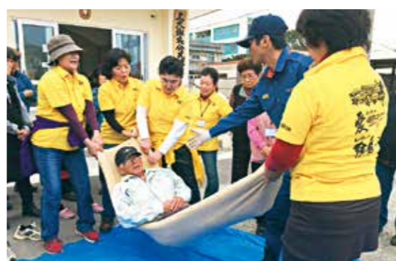
▲災害時を想定した防災訓練

人と協働する自治会づくり 嘉数区のティガネー(手伝い)会では「ちよこボラ(ちよこっとボランティア)」で地域を元気に！をテーマに、通学路の草刈りや独居高齢者の庭木の剪定を行っており、今年から歩道の花壇づくりに取り組んでいます。 宇地泊区自治会の「さわやかグリーン愛護会」は、長年環境美化に力を入れており、昨年12月から、真志喜中学校と協働し、宇地泊区の生徒たちと清掃活動や花植え活動を行っています。 定期的な住居周辺や道路、公園等の清掃活動は、防犯や事故を未然に防ぎ、住民が安心して快適に暮らせる地域づくりに繋がります。