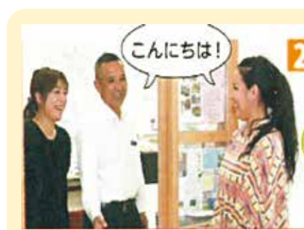
▲自治会のこと、地域のことを住民へ丁寧に説明しています

なお、最寄りの自治会の住所・連絡先等が分からない場合は、「宜野湾市 自治会」でインターネット検索するか、市民協働課までご連絡ください。 ☎893-4497