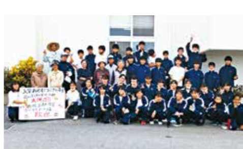
▲真志喜中学校の地域貢献学習 地域への関心や愛着を生み、将来の担い手育成につなげる