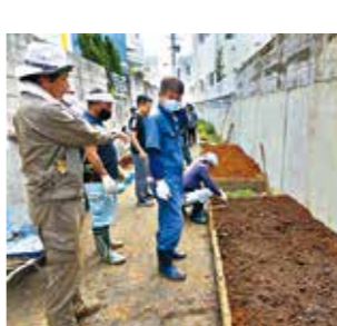
▲花植え活動 地域的美観を確保する

人と協働する自治会づくり 嘉数区のティガネー(手伝い)会では「ちよこボラ(ちよこっとボランティア)」で地域を元気に！をテーマに、通学路の草刈りや独居高齢者の庭木の剪定を行っており、今年から歩道の花壇づくりに取り組んでいます。 宇地泊区自治会の「さわやかグリーン愛護会」は、長年環境美化に力を入れており、昨年12月から、真志喜中学校と協働し、宇地泊区の生徒たちと清掃活動や花植え活動を行っています。 定期的な住居周辺や道路、公園等の清掃活動は、防犯や事故を未然に防ぎ、住民が安心して快適に暮らせる地域づくりに繋がります。