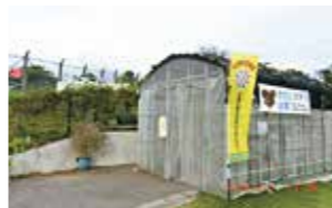
▲オオゴマダラの家 (上大謝名さくら公園の一角)

地域の实情に合わせた様々な地域資源の活用 ●伝統行事やモノを活かす自治会づくり 各自治会では、地域の行事、文化財の管理等により、地域の方と交流できる機会を増やせるよう取り組んでいます。 例えば、真志喜区の大綱引きは、地域住民への豊かな恵みと安全、子孫繁栄を祈願する神事として住民総出で取り組み、多くの方々が見に来られます。 また、上大謝名にある「オオゴマダラの家」は、子ども達への自然学習や飼育体験をとおし、自然環境の素晴らしさを伝え、好奇心を育む場となっています。