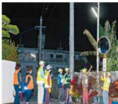
▲防犯灯の設置、定期点検

今後の展望 自治会加入率が23・5%(令和3年度末)まで落ち込んでおり、自治会活動の担い手不足や活動費の捻出に苦慮しています。 今後は地域資源を有効活用し、地域の魅力や困りごとを幅広い世代、地域間で情報共有できる機会を設け、時代の変化と地域のニーズに対応した自治会活動を展開していきます。