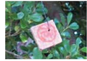
▲誘殺板(「危」の印字有り)

ミカンコミバエは、主に果物等に寄生する害虫ですが、1986年には沖縄県全域から既に根絶しており、現在日本では生息していない虫です。しかし、台湾やフィリピンなどの東南アジアでは今でも生息しており、台風の風や人および物流により、再侵入する可能性があり、それを防ぐため、沖縄県では関係機関と連携して、現在でも予防防除を行っています。予防防除では、誘殺板を街路樹等に取り付けます。防除へのご理解・ご協力、よろしくをお願いします。なお、誘殺板には触らないようにお願いします。