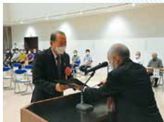
▲9月14日(水)当選証書授与式