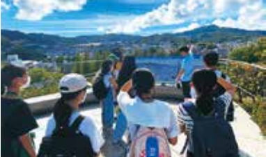
▲原爆落下地点を学ぶ平和大使