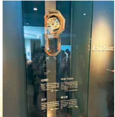
▲原爆落下時刻で時がとまった時計

8月9日には、「長崎原爆犠牲者慰霊平和祈念式典」に参列し、原爆で犠牲となった方々のご冥福と恒久平和を祈り、長崎や沖縄で起きた悲劇が繰り返されることのないよう多くの人に伝え、平和を継承していくことを誓いました。