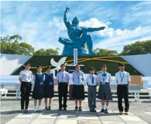
長崎原爆犠牲者慰霊平和祈念式典

8月9日には、「長崎原爆犠牲者慰霊平和祈念式典」に参列し、原爆で犠牲となった方々のご冥福と恒久平和を祈り、長崎や沖縄で起きた悲劇が繰り返されることのないよう多くの人に伝え、平和を継承していくことを誓いました。