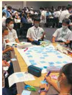
▲全国の青少年と意見交換を行う様子