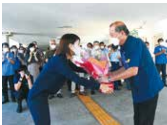
▲9月30日(金)市長就任式

9月11日(日)に執行された宜野湾市長選挙で再当選し、第19代宜野湾市長に就任した、松川正則市長の2期目の市政がスタートしました。