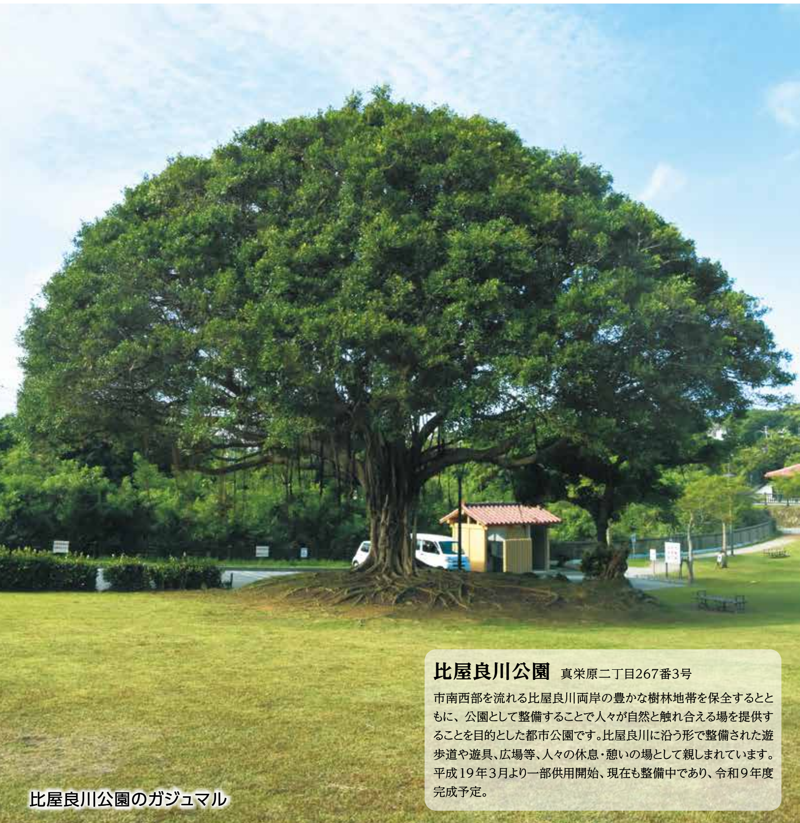
比屋良川公園のガジュマル