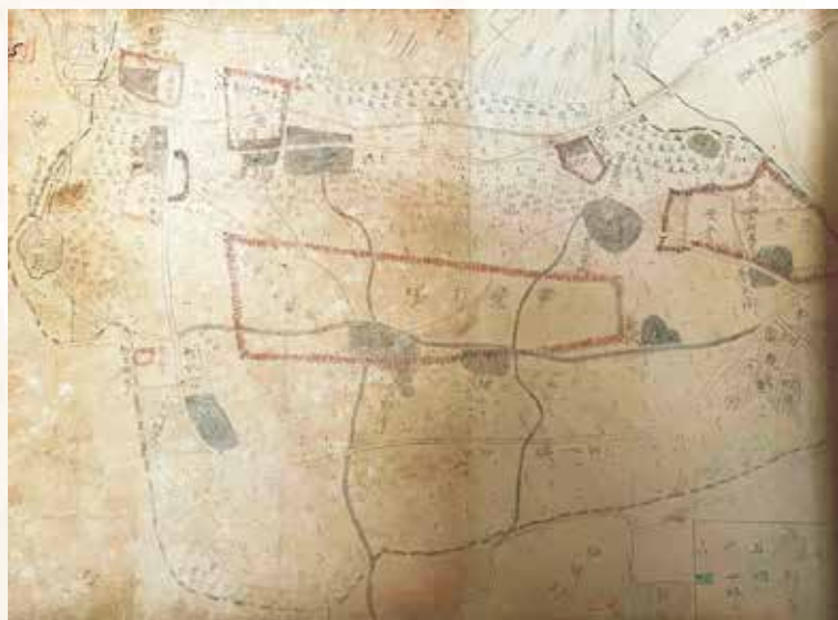
▲「略図調整報告二関スル件」(1946年10月19日付)の実際の図 『一般行政関係書』(1946年-1954年)から掲載

当時の宜野湾村は移動できる字が嘉数や我如古など、一部の地域に限られており、収容所だった野嵩には村役場や学校、郵便局などの施設が集中していました。この文書では、当時の村内にある施設などを略図で報告した旨になっています。 この記録から、当時の軍用施設の位置がわかる他、米軍からの移動許可が下りていない地域が多かったことが窺えます。 このように、歴史公文書を保存することで、当時の、起きた出来事や人びとの生活背景を行政の側面から見て、現代の私たちにもその様子を伝えてくれます。