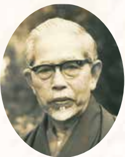
山田 真山(1885~1977) 終戦直後から宜野湾市普天間に居を構え、晩年の約20年、平和祈念像原型の制作に打ち込んだ。

1972(昭和47)年5月15日、沖縄は27年間のアメリカの統治から解放され、本土復帰(日本復帰)を果たしました。今年はその50年節目であり、様々な記念グッズが展開されています。こうした記念グッズは節目毎に登場し、1972年の復帰当時からあります。その一つが、山田真山氏デザインの「沖縄日本復帰記念メダル」です。 このメダルは、琉球政府公認第1号として発行され、その売り上げは、当時普天間のアトリエで制作中だった、沖縄平和祈念像(当時の名称は「沖縄平和慰霊像」)原型の制作資金に充てられました。 このメダル、表面には平和祈念像、裏面には天女が描かれており、実は宜野湾に馴染みの深いデザインとなっています。