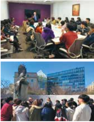
▲平成31年米国派遣時の様子

募集要項、日程案、応募申込方法等の詳細については、市ホームページをご確認ください。