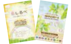
介護長寿課にて命しるべ、エンディングノート無料配布中(100冊限定)

宜野湾市では、中部地区医師会在宅ゆい丸センターに委託し、地域の方々へ普及啓発活動をおこなっています。自分自身、また親や祖父母などの大切な人が、人生の最期まで住み慣れた地域や場所で自分らしく過ごすことができるよう、元気なうちから、好きなこと・嫌いなこと・大切だと感じることなど、お話ししてみませんか?