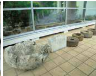
写真① 玄関横に並べられた石製の資料たち。左側から「ンムアライトーニ」、「チール石(ウコール石)」、4個の「サーターグルマ」

サトウキビの圧搾機の一部で、横に3つ並べた石の間にサトウキビを通して搾りました。写真②は、火災前の首里城で使用された砂岩の「礎石」で、その幅は約75センチあります。「礎石」とは、建物の柱の基礎のことで柱の下に置かれました。これは、沖縄県主催の「首里城火災破損瓦等に係る活用事業」により引き取ったものです。この礎石の大きさから、建物の大きさが想像できるかと思えます。 このように、昔の文化や暮らしを知ることの出来る貴重な資料が、玄関横にひっそりと展示してあります。博物館へお越しの際には、ぜひ皆さまにご覧いただきたいと思っています。