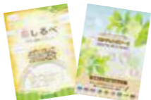
介護長寿課にて命しるべ、エンディングノート無料配布中(100冊限定)

宜野湾市では、中部地区医師会在宅ゆい丸センターに委託し、地域の方々へ普及啓発活動をおこなっています。自分自身、また親や祖父母などの大切な人が、人生の最期まで住み慣れた地域や場所で自分らしく過ごすことができるよう、元気なうちから、好きなこと・嫌いなこと・大切だと感じることなど、お話ししてみませんか?