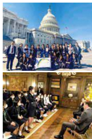
▲2022 年度米国派遣時の様子

募集要項、日程案、応募申込方法等の詳細については、市ホームページを「確認」ください。