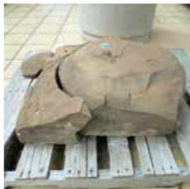
写真② 首里城の「礎石(そせき)」。火災によって変色やひび割れが生じています。

写真①の一番手前にあるのが「ンムアライトーニ」といって、芋を洗うための石灰岩製のタライです。タライに水を入れ、足踏みで芋を洗います。使用後は、底の水抜き孔にはめた栓を抜き、水を捨てました。次は、石灰岩製の香炉石「チール石(ウコール石)」です。野嵩一区内にあった亀甲墓の墓口で使われていた、線香を立てるための台で、昭和10(1935)年頃に造られたものです。その隣にある4つ並んだ石輪は、砂岩で造られた「サーターグルマ」です。