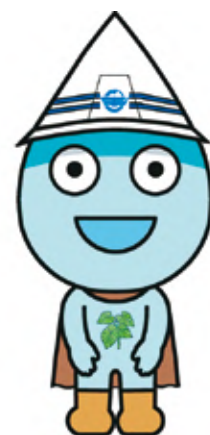
宜野湾市上下水道局のキャラクター「みじたまくん」

また、公共下水道への接続についてご不明な点がありましたら下記の間合せ先までご連絡ください。