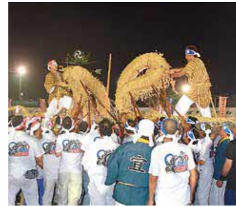
▲カナチチヂの時から両者の駆け引きが始まります。(平成29年撮影)

戦前の宜野湾では、14の字で綱引きが行われ、特に字宜野湾は旧暦6月15日または25日に綱引きを行いました。その日は集落を前村渠と後村渠に分け、綱引き会場のジノーンウマイ（宜野湾馬場）に向けて道ジューネをしました。ウマイでは、双方の男性が取っ組み合うトーセー