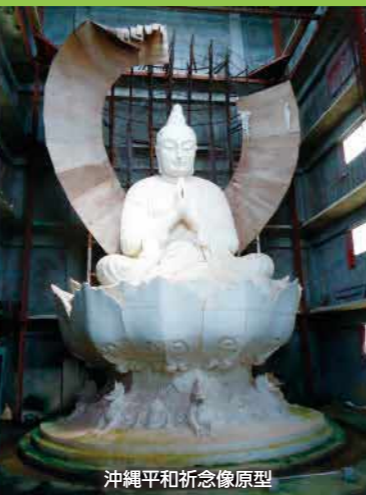
沖縄平和祈念像原型

昨年度の寄附実績額 1,321,000円(71件) ご支援ありがとうございました。