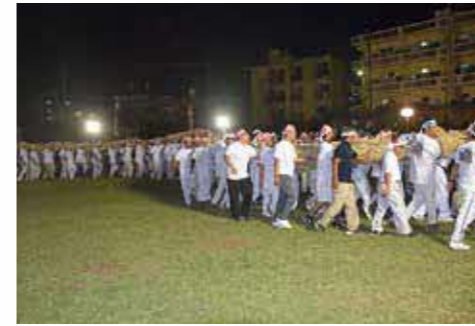
▲ムルイヂナは会場いっばいに蛇行しながら行進しました。(平成29年撮影)