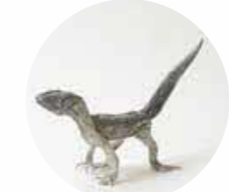
クロイフトカゲモドキ (前回の作品)