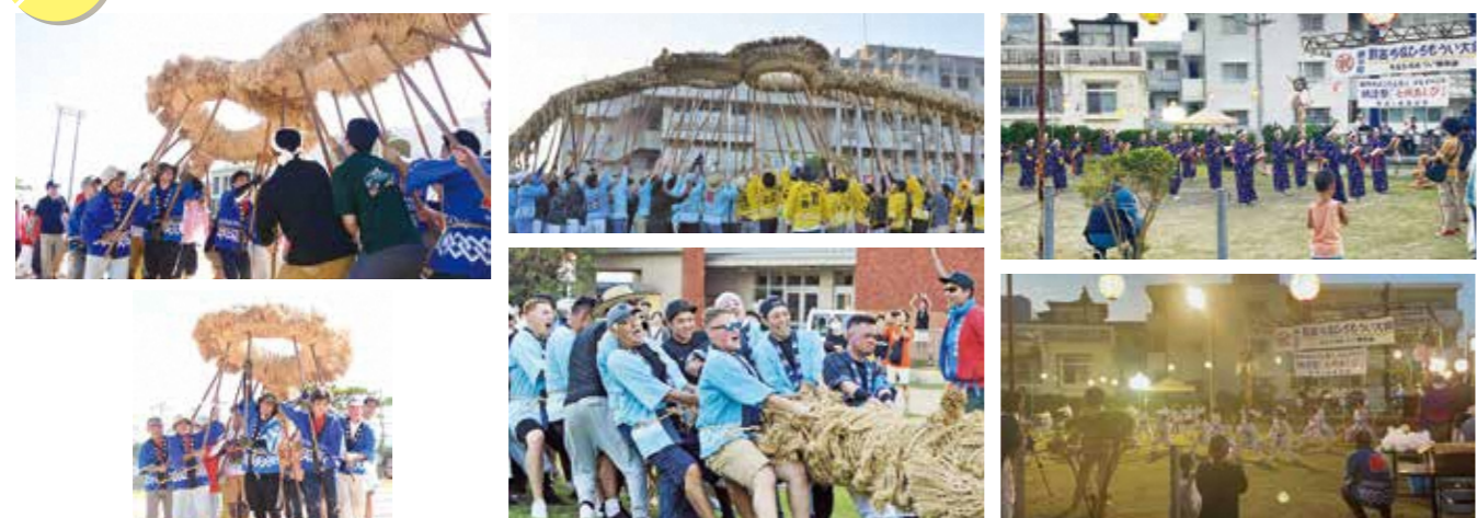
真志喜大綱引きの様子