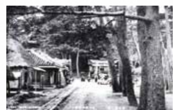
普天満宮と並松(昭和13年頃)