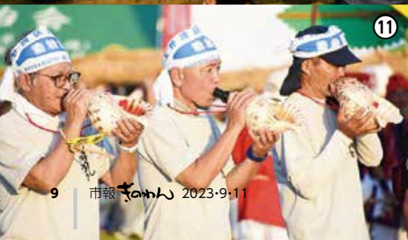
①両綱を結合するために綱寄せをする両陣営。②勝利を収め喜び後村渠の皆さん。③OB会・婦人の皆さんによるサングワチャー踊り。④婦人の皆さんによる前舞い(メーモイ)。⑤・⑩一斉に綱を引く区民と来場者。⑥子ども会による鼓灯籠(チデンドゥール)。⑦お揃いのTシャツに身を包む参加者の皆さん。⑧旗頭ガアーで会場を盛り上げる。⑨両陣営の棒持ちによるシーチエー。⑩ほら貝を吹く前村渠の皆さん。