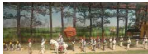
普天間参詣行列図(模型) 市立博物館蔵

このマニュアルによると、首里城を出発した国王一行は、宜野湾間切番所(後の村役場)でお茶とたばこの接待を受けたのち、普天間宮の鳥居の前で、神宮寺住職や宜野湾間切の総地頭、普天間村の地頭や地頭代といった、地域を代表する人びとに迎えられています。 王子など身分の高い人びとも鳥居の前で下馬(馬から降りる)することが決められていました。 涼傘と呼ばれる大きな日傘や、国王に風を送るための巨大なうちわも準備されていました。旧暦の9月は、当時もまだ、暑い時期だったことがわかります。