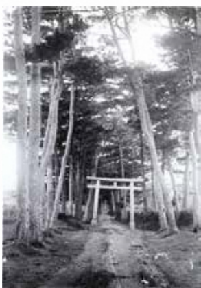
宜野湾並松と一の鳥居 (大正13年頃)

中体連県大会 優勝 7大会制覇 女子ソフトボール部 宜野湾・真志喜合同チームの皆さん