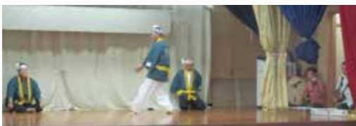
じのーん舞方(2022)(宜野湾)

沖縄県では沖縄空手(古武術を含む)の伝統文化としての価値を次世代に伝えていくとともに「空手発祥の地・沖縄」を国内外に広く発信するため、県内の幅広い分野の関係機関・団体と連携し、沖縄空手のユネスコ無形文化遺産登録を目指しています。 空手は披露宴やトウシビー(生年祝)等の祝いの席、綱引きやハーリー等の祭礼行事、地域の敬老会や学校の運動会等で、型の演舞が行われるなど県民生活に広く浸透しています。また、琉球舞踊とは類似性があり、エイサーには空手の所作が組み込まれています(沖縄県作成資料より)。 宜野湾市では「野嵩マールアシビ」