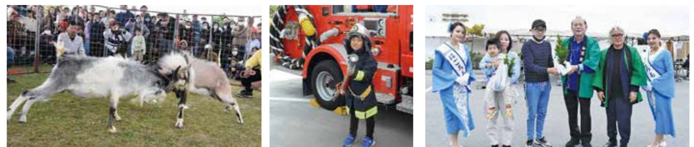
▲ヒージャーオーラセー ▲はたらくのりものコーナー ▲サンダンカ苗木配布