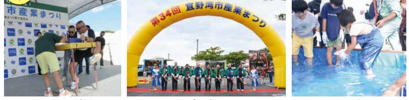
▲アームレスリング大会 ▲オープニングセレモニー ▲魚つかみ取り