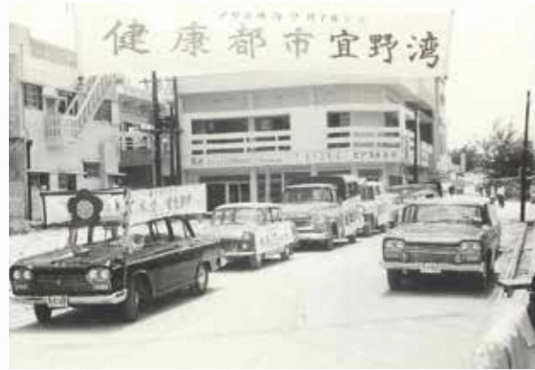
健康都市宣言の市内一周のパレード(普天間) 1964(昭和39)年

60年前、宜野湾市では… 新年、明けましておめでとうございます。 2024年が始まりました。 さて、今から60年前、1964(昭和39)年の宜野湾市の様子を見てみると、この年は、現在の22の行政区ができた、すなわち新行政区が設置された年です。自治会によっては、設立の祝賀会を開き、新しい自治会作りを喜び合いました。