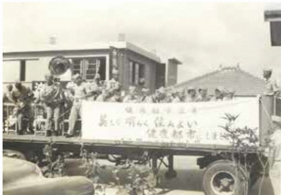
普天間のマリン音楽隊も参加してパレードを盛り上げた