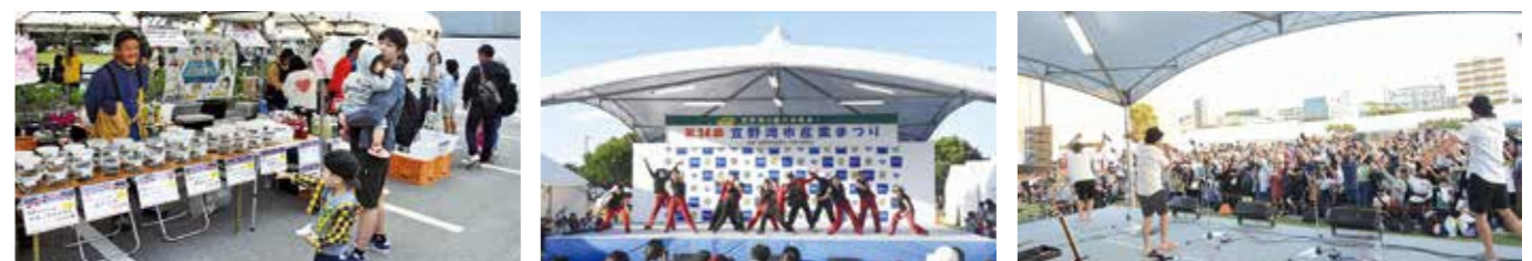
▲会場の様子 ▲ステージイベント

宜野湾海浜公園において「第34回宜野湾市産業まつり」が開催されました。まつりは、市県産品の農水産物や花木、商工業製品の展示販売、県産木材を活用した木工体験、山羊が頭をぶつけ合う「ヒージャーオーラセー」などが催されました。さらに、子どもに大人気の「ミニヤギふれあいコーナー」「魚つかみ取り」も行われ、会場は多くの来場客で賑わいました。ステージでは、ダンスパフォーマンスやアームレスリング大会、地域サークルによる出し物などが披露され、終盤にはアーティストによる圧巻のライブでまつり最高潮の盛り上がりを見せました。初開催の「はたらくのりものコーナー」では、パトカーや消防車、ショベルカー等が展示され、実際に試乗して操作を体験したり、制服を着て記念撮影を行ったりと、大人も子供も迫力満点ののりものに夢中になっていました。また、両日行われた苗木無料配布では、配布前から行列ができ、市長とはごろもレディによる手渡しで、本市の花木である「サンダンカ」の配布・PRをすることが出来ました。