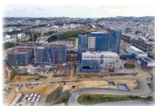
キャンプ瑞慶覧西普天間住宅地区跡地

令和6年度も、活力と活気に満ちた、豊かで安心して住み続けられるまちづくりを目指すとともに、すべての市民が「やっぱり宜野湾がいちばん！」だと実感していただけるよう、全職員一丸となって、市民の皆さまおよび市議会と連携して市政運営に全力を尽くしていく所存であります。