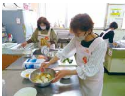
▲【離乳食教室】試食用離乳食準備の様子