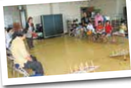
段ボールの手作りおうちで生活してみたり