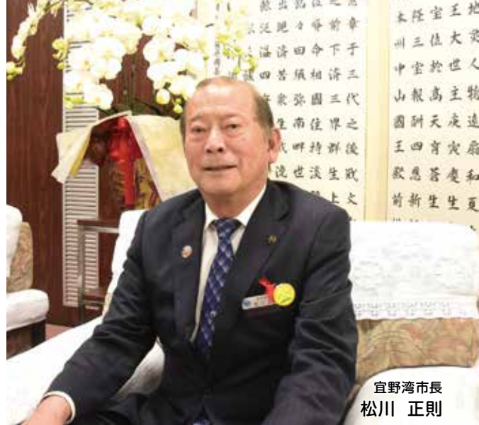
宜野湾市長 松川 正則

令和6年能登半島地震においては、最大震度7を観測し、大津波や土砂災害、地盤沈下、火災等により、多くの方が被災され、過酷な寒さの中で避難生活を強いられ、お亡くなりになられた方のご冥福をお祈り申し上げますとともに、被災された方へお見舞い申し上げます、被災地の一日も早い復興を願っております。