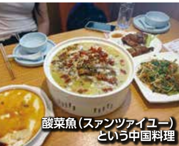
酸菜魚(スアンツァイユー)という中国料理