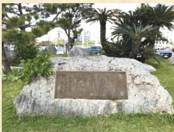
▲「瑞泉潤民」の碑 那覇市上下水道局庁舎前

しかし、那覇への送水を祝ってオーグムヤーガーに建立された「瑞泉潤民」の記念碑は、那覇市おもろまちの「那覇市上下水道局・みずプラッサ」の庁舎前に移され、今日でも目にする事ができます。古来よりあらゆる生き物において欠かすことのできない「水」、これからも感謝の気持ちを持ち続け大切に使用させて頂きましょう。