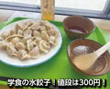
学食の水餃子！値段は300円！