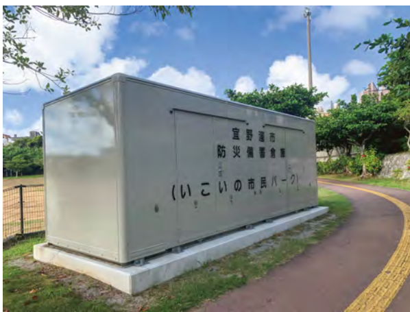
▲いこいの市民パークに設置された防災倉庫

基本施策「交通安全・防犯対策の強化」につきましては、交通安全の意識啓発及び老朽化した交通安全施設の更新に取り組みます。また、特殊詐欺被害防止に関する啓発活動を行うとともに、犯罪を繰り返さないための再犯防止推進計画を第五次宜野湾市地域福祉計画とあわせて策定いたします。さらに、犯罪に遭われた方に適切な支援を行う、宜野湾市犯罪被害者等支援条例を本定例会において提案しております。