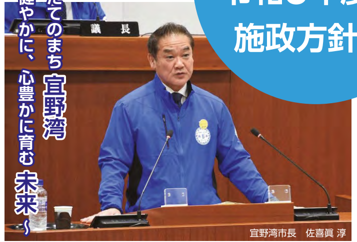
宜野湾市長 佐喜眞 淳