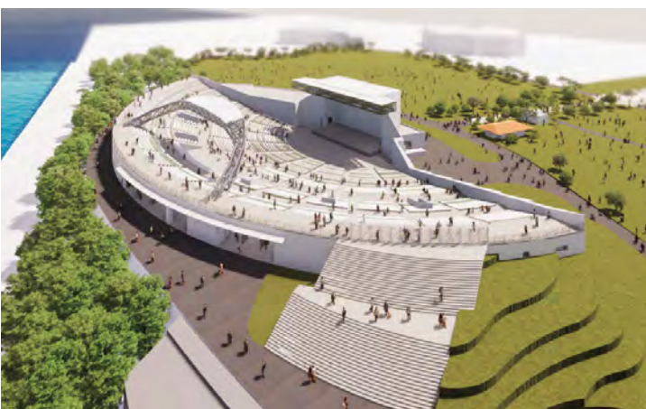
▲令和8年度完成予定 宜野湾海浜公園屋外劇場

漁業の振興につきましては、漁業者への燃油費の補助を継続し、経営の安定化を支援いたします。また、市産業まつりなどの機会を通して、浦添宜野湾漁業協同組合や漁業者と連携し、主要水産物であるソデイカや海ぶどうなどの販売促進活動に取り組んでまいります。