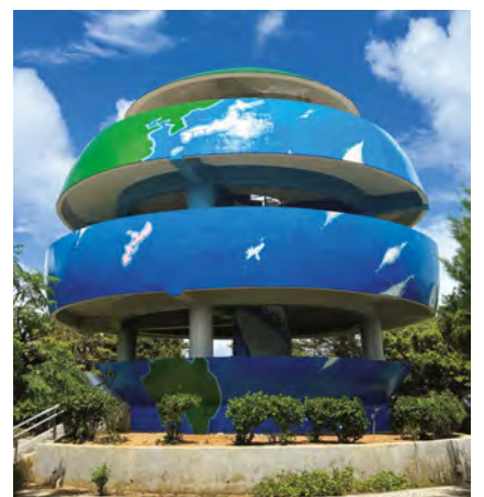
▲嘉数高台公園内の展望台

基本施策「平和行政・平和教育の推進」につきましては、戦争の悲惨な記憶を風化させぬよう、世界平和を希求する「宜野湾市反核、軍縮を求める平和都市宣言」の理念の下、平和の大切さや命の尊さを次世代へ継承するため、「宜野湾市平和大使」の育成に取り組んでまいります。