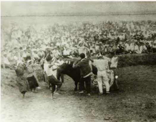
▲カチャーシーを踊る勝った牛の関係者たち(愛知) 1961(昭和36)年

昭和の初期ごろまでは、勝負の最中に一方の牛が舌を出したら負け判定となり、相手を傷つける前に勝負を決していました。しかし、1941(昭和16)年ごろからは観客から入場料を徴収するようになり、一方の牛が降参するまで勝負を続けるカッシン(合戦)が行われるようになりました。そして、勝負に勝つためには牛を強くする必要がありますため、体作りトレーニングはもちろん、日々の食事面でも牧草やキビの葉を与え、勝負が近づくと食事の量を調整しながら卵や豆腐を混ぜた米を与えるなどの気遣いもあつたようです。そして、実際の勝負に勝つと、勝った牛の主やその親戚・知人たちは歓喜に沸いてウシナーに飛び出し、カチャーシーを踊ったりする光景もよく見られました。