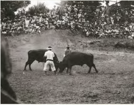
▲暑い中、勝負を見守る観衆はバサージン(芭蕉布の着物)、ムンジユル笠、パナマ帽を身に着けている。

今回は、戦前から庶民の人気があり、「ウシオーラセー」という呼称で知られる闘牛を紹介します。かつて、宜野湾村内の多くの旧集落には「ウシナー」または「ウシモー」と呼ばれた闘牛場がありました。一方、闘牛場が無い集落では、近隣の地域と組合を作つて闘牛場を運営したり、周辺地域の闘牛場を借りて闘牛を行うほどの人気ぶりでした。