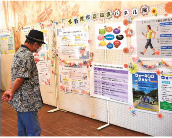
▲令和7年10月認知症月間イベントの様子

認知症対策につきましては、見守り自動販売機等運営委託事業の推進により、引き続きご本人とご家族が安心して暮らせるまちづくりに取り組みます。