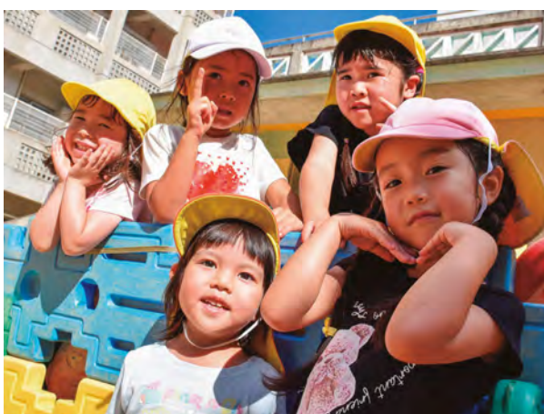
▲市内こども園 園庭で遊ぶ園児の様子

次にグローバル教育の推進につきましては、ALT（外国語指導助手）の全校配置や英語検定料助成を通じ、外国語教育をさらに充実させてまいります。あわせて、中学生の短期海外留学派遣事業を実施し、生きたコミュニケーション能力と異文化を理解する心を育ててまいります。