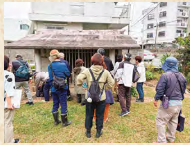
◀喜友名グスク香炉群