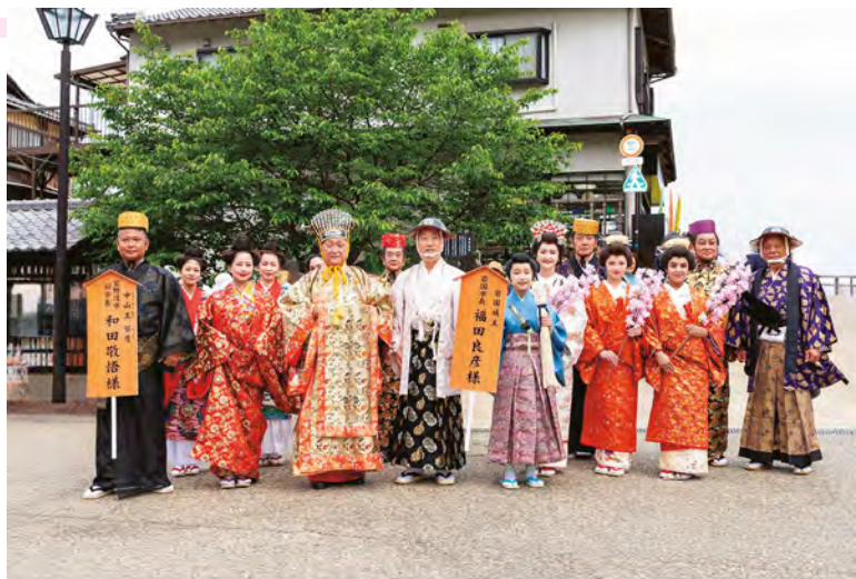
▲琉球王朝衣装の宜野湾市訪問団と岩国城主ご一行

宜野湾市訪問団は、豪華絢爛な琉球王朝衣装をまとい、城下町風情溢れた歴史ある街並みに、沖縄の伝統文化の花を添えました。