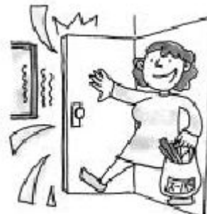
ドアを あける 音 おと ・しめる 音 おと

ほかに 楽器の 音 おと 、シャワーや 水を 流す 音 おと などが あります。