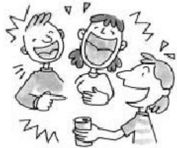
大きい 声 こえ