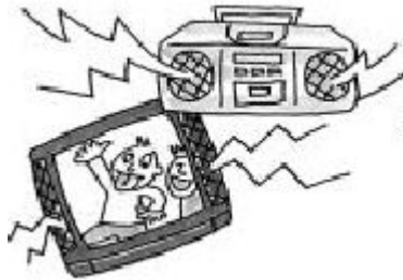
テレビ、ラジオ、CD プレイヤーの 音 おと