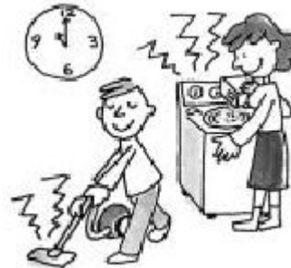
掃除機や 洗濯機の 音 おと