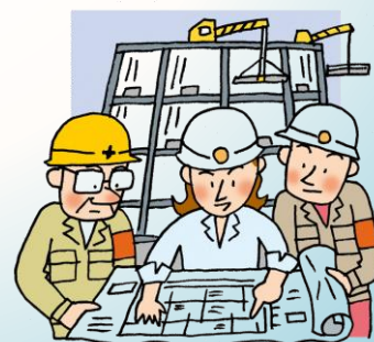
女性のキャリアアップ