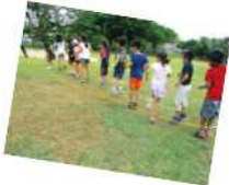
☎子ども企画課 内線 461 ※窓口が保育課から子ども企画課へ変更になりました。