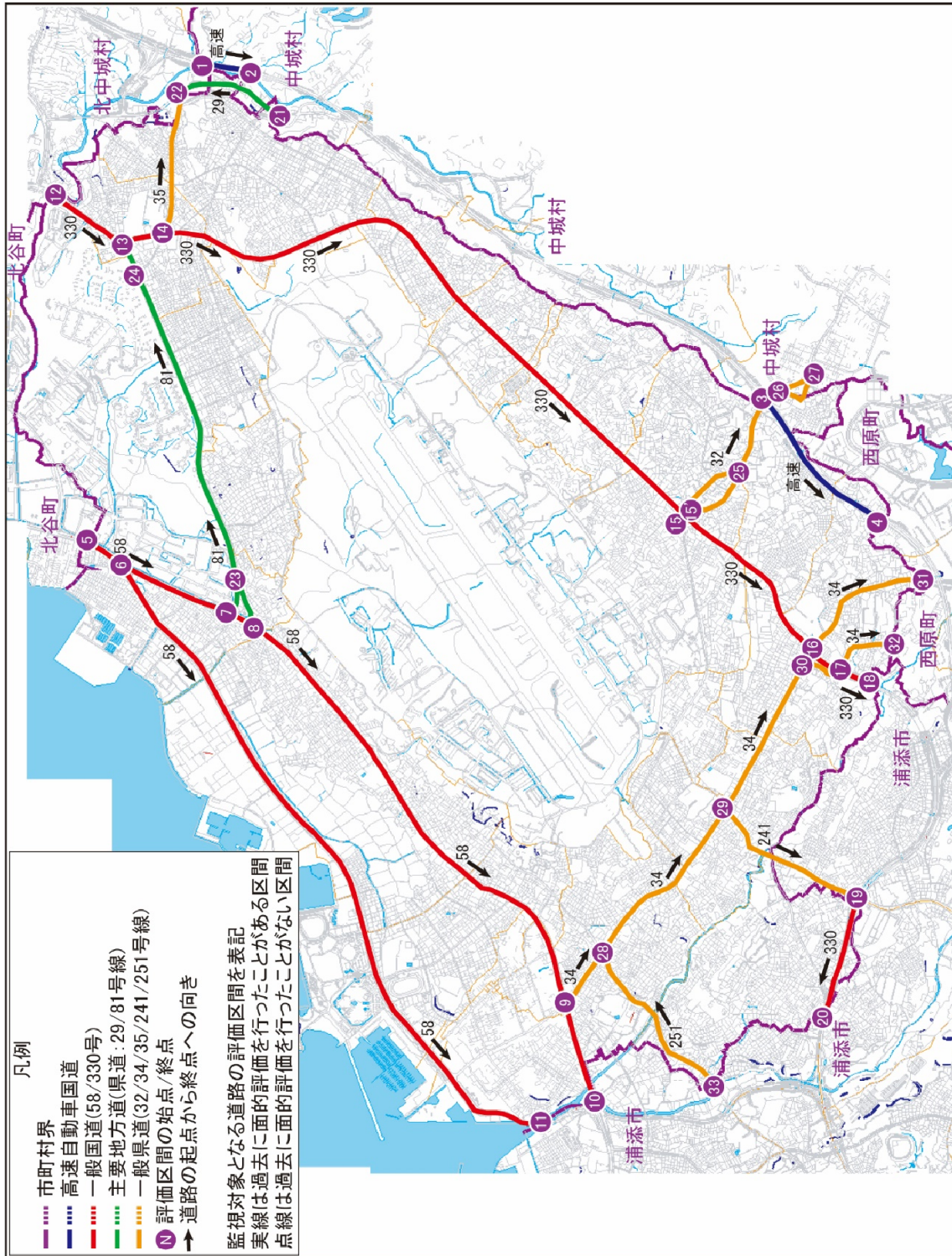
図 2.1 評価対象道路