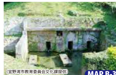
MAP B-3

普天間飛行場の用地を一部返還して建設され、沖縄戦を題材にした作品の常設展示のほか、企画展や演奏会の開催もあります。 開/9:00~17:00 休/火曜日・年末年始 料/大人800円、中高600円、小人300円※団体割引有 住/宜野湾市上原358 ☎098-893-5737