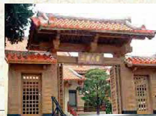
ふてんまざんじんぐうじ 普天満山神宮寺