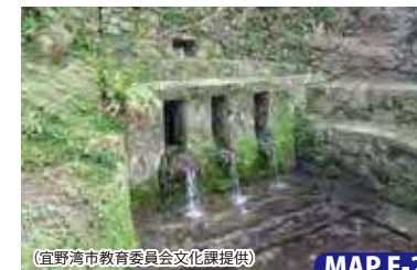
(宜野湾市教育委員会文化課提供) MAP E-2

見学の際には事前連絡が必要です。 住/宜野湾市字喜友名西原1607 問/宜野湾市教育委員会文化課 ☎098-893-4430