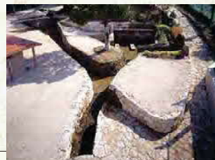
ちゅんながー 喜友名泉 (国指定有形文化財)

「宜野湾間謝名村に林岳あり、西森と名づく。清泉あり、森の川と名づく。往昔、天女ここにありて、もく浴するの時、奥間大親なる者ありてかいごうしてこれをめとる。すでに一女一男を生む。それ男は察度と名づけ後に王位に登る(後略)」と。