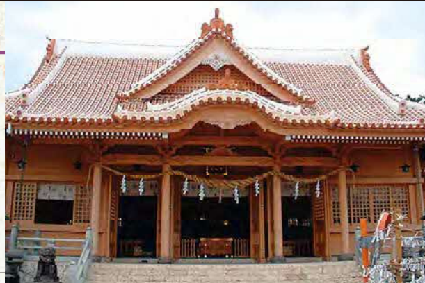
ふてんまぐう 普天満宮