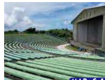
屋外劇場 ※新屋外劇場建設中

県内初の本格的野外劇場は5,000人収容可能でロックコンサートや屋外イベント等に利用されています。