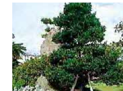
リュウキュウコクタン(市木) 樹皮は平滑で黒褐色、小枝は灰褐色で1年枝には多少絹毛があり葉はかたい。家庭樹、道路緑化樹、公園樹、盆栽、また昔から三味線のさおとして重宝がられている。(平成8年1月11日制定)

「ねたての都市ぎのわん」は、21世紀をリードする限りない発展を秘めた沖縄県の中核都市として、宜野湾市を象徴する市民の合言葉としています。