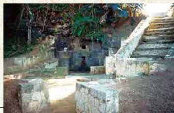
がにく 我如古ヒージャーガー

野嵩石畳道は、近世首里王府時代(約380~110年前)に整備された首里と間切(現在の市町村に相当)を結ぶ公道、いわゆる「宿道」に築かれたものです。