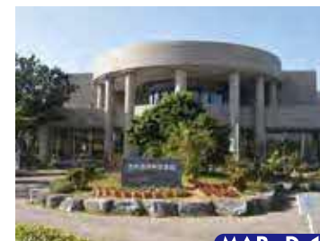
宜野湾市民図書館

開/水・木・金10:00~19:00、月・土・日10:00~17:00 休/火曜日・第4木曜日・祝祭日・慰霊の日(6/23)・年末年始 P/有 住/宜野湾市我如古3-4-10 ☎098-897-4646