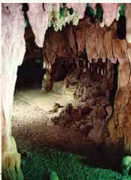
ふてんまぐうどうくつ 普天満宮洞穴