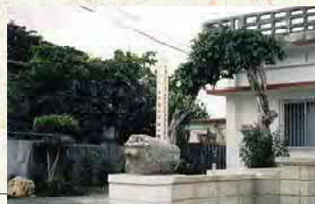
きゆな いしじしぐん 喜友名の石獅子群