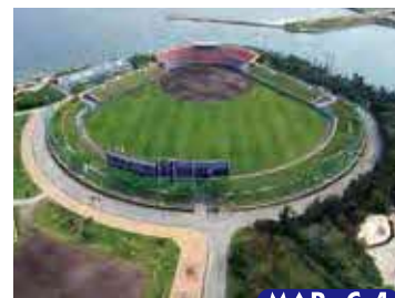
宜野湾市立野球場