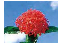
サンダンカ(市花木) 花もちが長く、年2〜3回開花し彩りもあざやかで、亜熱帯的花木である。繁殖、苗の確保も容易であり、庭園、鉢植え、公園花木としても用途が広い。(昭和50年12月9日制定)