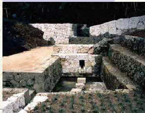
もりかわ 森の川 (県指定名勝)