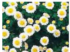
キク(市花) 年中栽培ができ、花もちが長く多色である。苗の確保、栽培管理及び繁殖が容易である。(昭和50年12月9日制定)