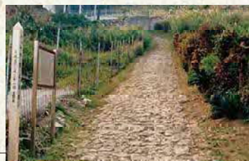
の だいきしだたみち 野嵩石畳道

喜友名区は、集落全体が晝盤の形のように規則正しく区画整理された古き時代の計画集落のひとつです。そこには、あたかも集落を取り囲むように石彫りのシーサー(獅子像)があり、部落や屋敷内に他から厄や忌み嫌われるものが入らないように、それらの「反し(ケーシ)」として置かれています。