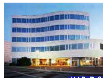
宜野湾ベイサイド情報センター

情報化社会に対応した支援啓発の複合施設。住/宜野湾市宇字地泊558-18 ☎098-942-8415