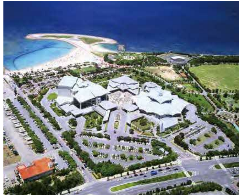
沖縄コンベンションセンター