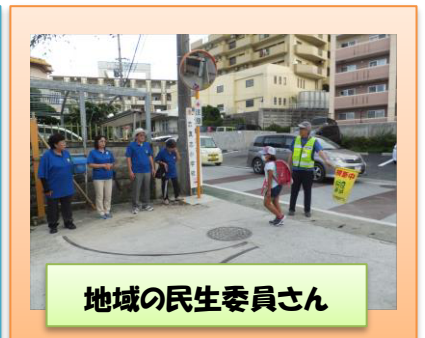
地域の民生委員さん