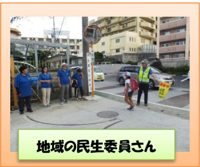
地域の民生委員さん